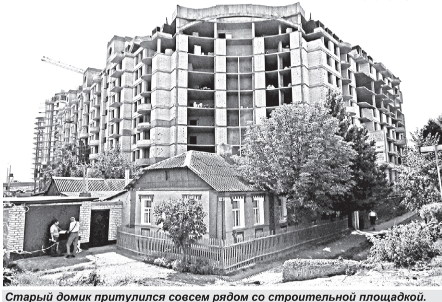
Старый домик притулился совсем рядом со строительной площадкой.

на котором расположено такое жилое помещение или расположен многоквартирный дом, в котором находится такое жилое помещение, для государственных или муниципальных нужд... Возмещение за жилое помещение, сроки и другие условия изъятия определяются соглашением с собственником жилого помещения».