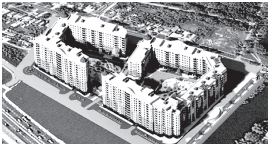
Так будет окончательно выглядеть жилой комплекс у Везелки.

«Договоренность с застройщиком не достигнута по ценовому вопросу», – разводят руками в комитете по управлению Восточным округом. А более подробно ситуацию нам объяснили в комитете имущественных и земельных отношений администрации города Белгорода. Но сначала маленькое отступление. Согласно статье 32 ЖК РФ «Обеспечение жилищных прав собственника жилого помещения при изъятии земельного участка для государственных или муниципальных нужд», «Жилое помещение может быть изъято у собственника в связи с изъятием земельного участка,