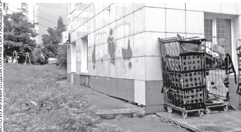
Улица Шаландина, 28