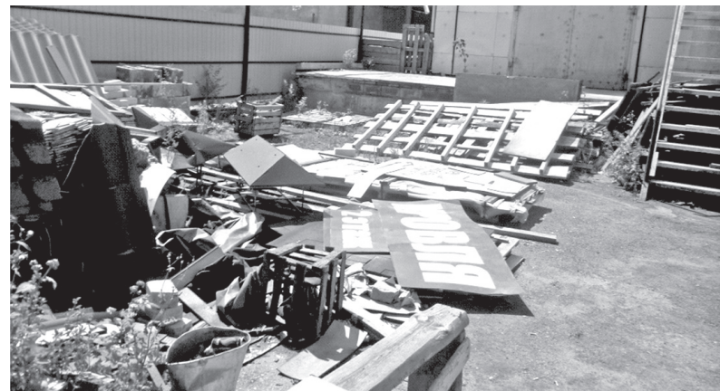
Улица Макаренко, 12А

Недаром кто-то метко заметил, что сила убеждения усиливается, если применить финансовые санкции.