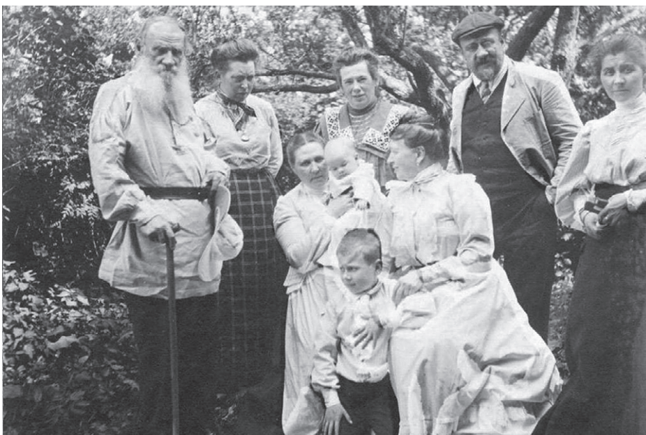
Л.Н. Толстой среди родных и близких. 1906 г. Ясная Поляна.

К 200-летию со дня рождения великого русского поэта М.Ю. Лермонтова наш музей предложил образовательным учреждениям две выставки: «Лермонтов – художник» и «Лермонтов в Москве». Созданные на основе фондовых коллекций Государственного литературного музея (г. Москва), они побывали в нескольких школах города и Белгородского района, в машиностроительном колледже. И сейчас