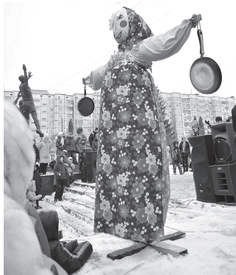
Материалы полосы подготовила Алина БОРИСЕНКО ФОТО БОРИСА ЕЧИНА

А в Чехии на Масленицу (печешки Masopust) молодые парни с лицами, вымазанными сажей, под музыку обходят всю деревню, везя за собой разукрашенный деревянный брусок – «клатик». Этот брусок парни вешают каждой девушке на шею или привязывают к ноге или руке. Если девушка хочет избавиться от ноши, должна заплатить.