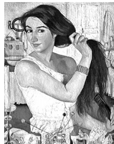
Автопортрет Зинаиды Серебряковой «За туалетом»

В Белгородском художественном музее поговорили об одной из первых русских женщин, вошедших в историю живописи, и открыли выставку ее работ.