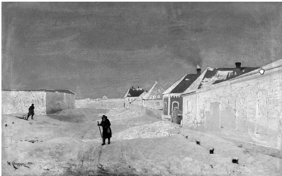
Юлий Феддерс. Улица зимою в Белгороде, 1886 г.

Так называется картина Юлия Феддерса - одно из самых ранних изображений города в живописи. Попробуем разобраться, что же за место выбрал для городского сюжета известный художник.