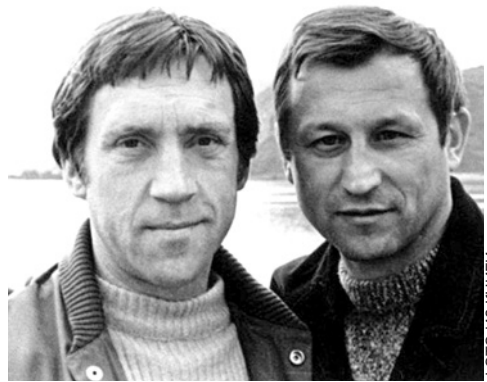
ФОТО ИЗ КНИГИ

Вечер памяти Владимира Высоцкого прошел 17 ноября в соборном зале Белгородской митрополии