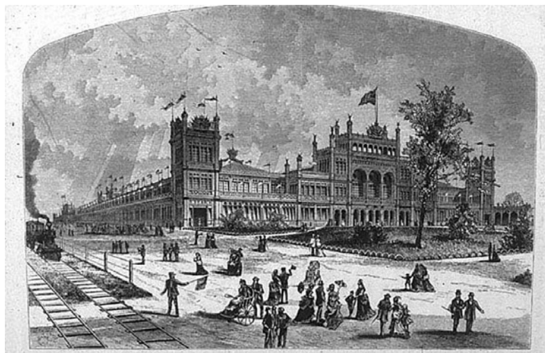
Павильон филадельфийской выставки.