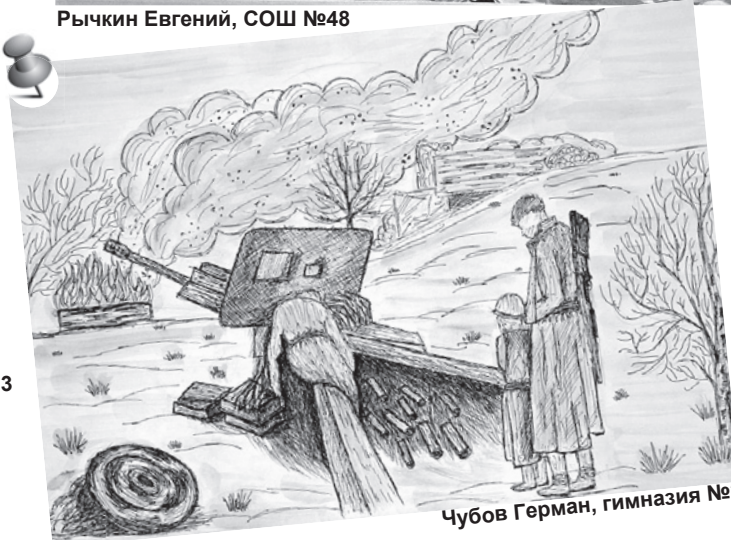
Чубов Герман, гимназия №3