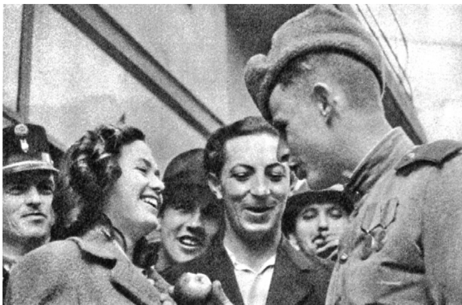
Венгерский народ встречает освободителей.

В последние годы в некоторых странах предпринимаются попытки пересмотреть события и итоги Великой Отечественной войны, придавая ей другой смысл. Но мир не должен забывать ужасы войны, страдания и смерть миллионов людей. Без памяти о прошлом ни у одного народа не может быть будущего.