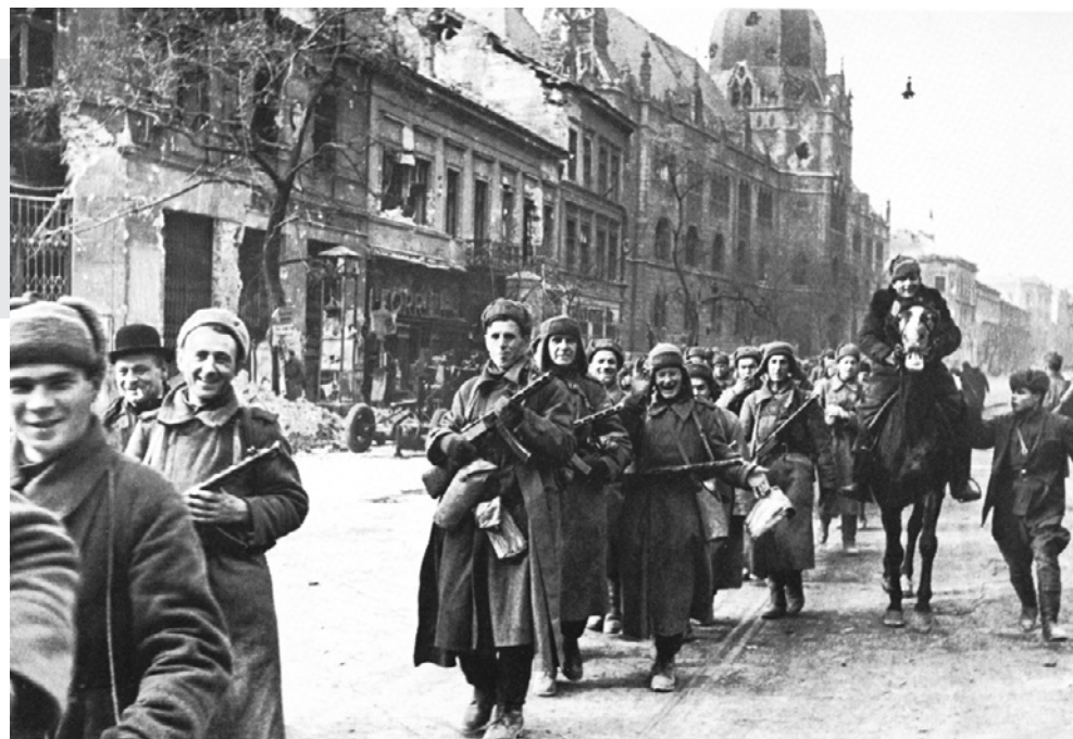
Будапешт. 13 февраля 1945 года.

Приближается самый главный для нашей страны праздник – День Победы в Великой Отечественной войне. В 2014 году исполняется 70 лет с начала победоносного похода Красной армии на Запад, который завершился освобождением стран Западной Европы от фашистских захватчиков и полным разгромом фашизма.