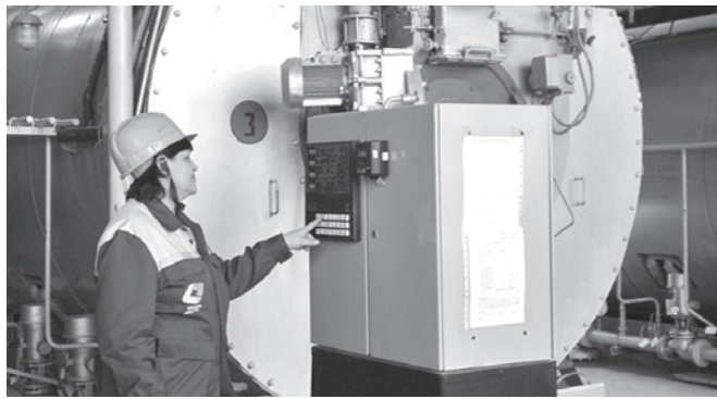
Оператор котельной СМР-1 останавливает котел.