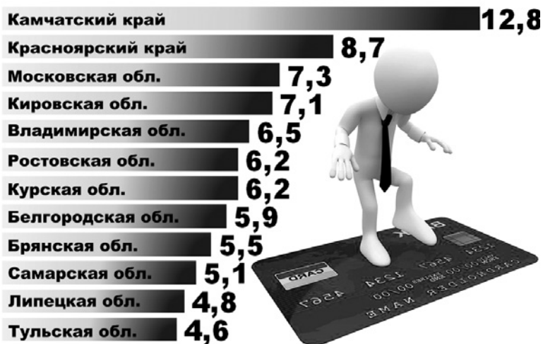
Диаграмма 1. РАЗМЕР МИНИМАЛЬНОГО ВЗНОСА НА КАПИТАЛЬНЫЙ РЕМОНТ В НЕКОТОРЫХ СУБЪЕКТАХ РФ.

от 25.11.2013 г.) в размере 5 руб. 90 коп. за 1 кв. м общей площади жилого (нежилого) помещения в месяц. Насколько эта величина соответствует значениям платежа, установленного в иных регионах страны, видно из диаграммы 1.