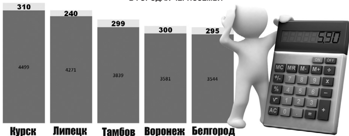
Диаграмма 2. РАСХОДЫ НА ЖИЛИЩНО-КОММУНАЛЬНЫЕ УСЛУГИ И ВЗНОС НА КАПРЕМОНТ В ГОРОДАХ ЧЕРНОЗЕМЬЯ

Данные говорят сами за себя. Воронежские аналитики сделали однозначный вывод: «По итогам подсчетов лучше всего жить в Белгороде». Если кто-то с их мнением не согласен, то скажем: «Хорошо там, где нас нет».