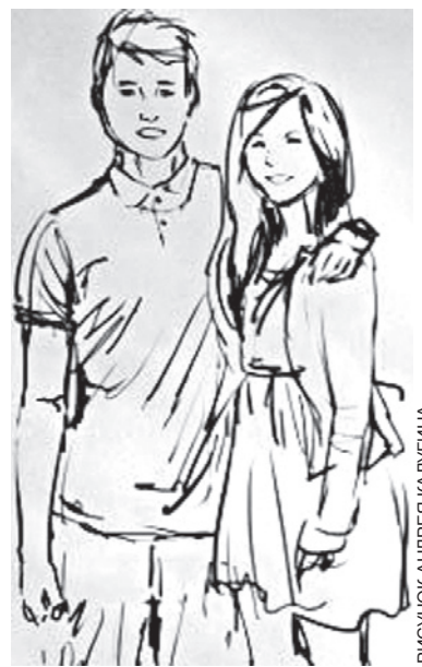
РИСУНОК АНДРЕЯ КАЛУГИНА

Итоги проекта будут подведены ко Дню города. Исходя из ваших мыслей, чаяний и пожеланий мы хотим создать Кодекс настоящего белгородца. Чем больше людей вложат частичку души, сердца, свои мысли и раздумья в новый проект, тем ярче получится разглядеть главные черты нашей малой родины. Только так мы сможем наиболее полно и всеобъемлюще отразить образ Белгорода и его жителей. Мы сделаем это вместе!