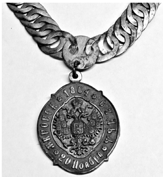
Медальон мирового судьи. 1864 г.

время в крупных городах начинают появляться отделы сыскальной полиции. Уроженец Нового Оскола Иван Дмитриевич Путилин возглавил отделы сыскальной полиции Санкт-Петербурга и империи. И.Д. Путилин вошел в историю как талантливый, опытный и незаменимый сыщик. Он лично раскрыл сотни преступлений, совершенных со всевозможной хитростью и жестокостью, на которую