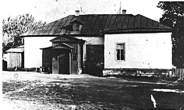
Земская школа в Ивне. Обоянский уезд.

время в крупных городах начинают появляться отделы сыскальной полиции. Уроженец Нового Оскола Иван Дмитриевич Путилин возглавил отделы сыскальной полиции Санкт-Петербурга и империи. И.Д. Путилин вошел в историю как талантливый, опытный и незаменимый сыщик. Он лично раскрыл сотни преступлений, совершенных со всевозможной хитростью и жестокостью, на которую