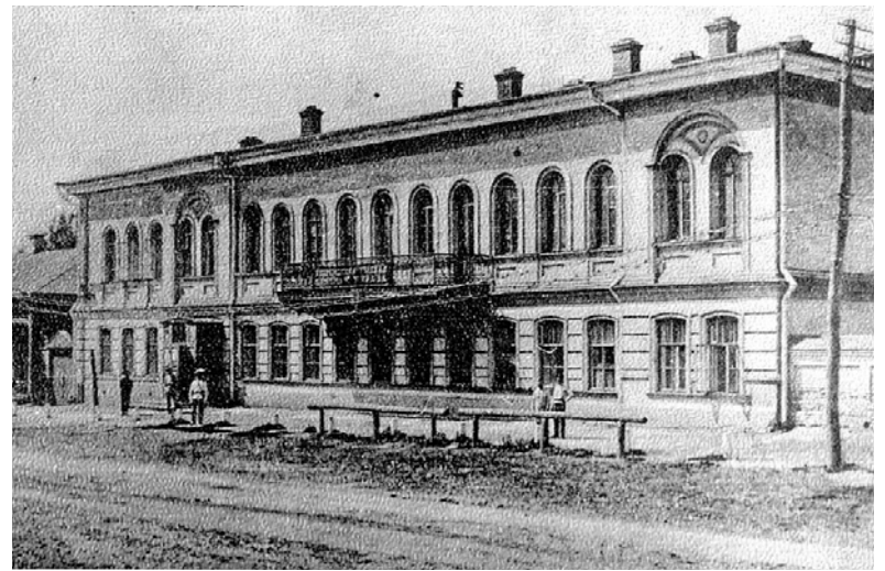
Земская управа в Белгороде.

Новые судебные уставы утвердили бессословность и относительную независимость судов, ввели гласность судопроизводства и состязательность судебного процесса, несменяемость судей и судебных следователей. Наивысшим достижением судебной реформы стало введение суда присяжных и института присяжных поверенных – адвокатуры. В это