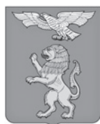
Не является публичной офертой. Р.Селаво

МБУ «Комплексный центр социального обслуживания населения города Белгорода»