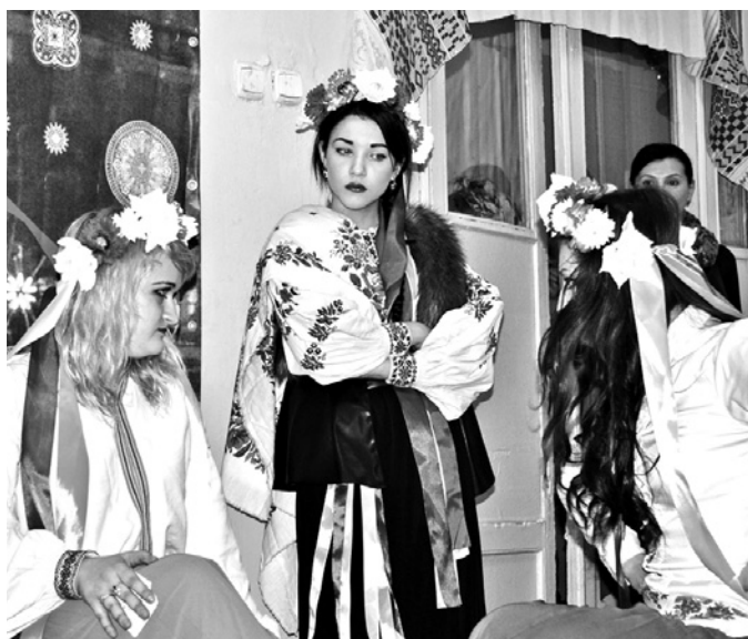
ФОТО ИЗ АРХИВА СОВЕТА ВЕТЕРАНОВ

Январь на Руси всегда славился праздниками, особенно любил народ Рождество Христово, Святки, которые сопровождались народными гуляниями. Устраивались ярмарки, катания на санях, проводились театрализованные представления, веселили людей скоморохи.