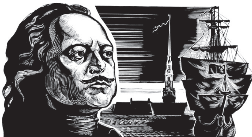
Р. ЯХНИН. Пётр Первый. 1980-е гг. Литография из коллекции В. Беликова

Сегодня в городе открылась выставка, посвященная поэме А.С. Пушкина «Полтава»