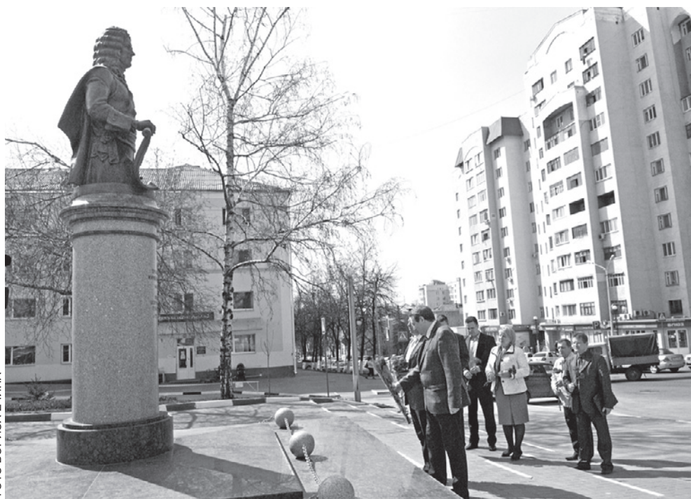
Возложение цветов к памятнику Ю.Ю. Трубецкого в г. Белгороде.