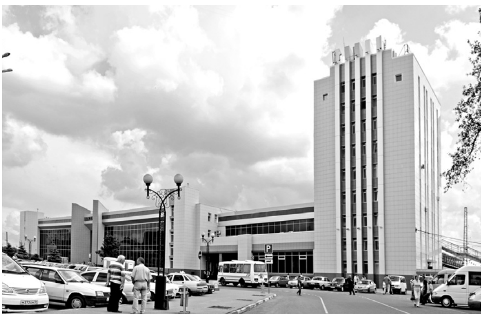
Привокзальная площадь. 2013 г.

ремонта, а значит, сделать его должно государство.