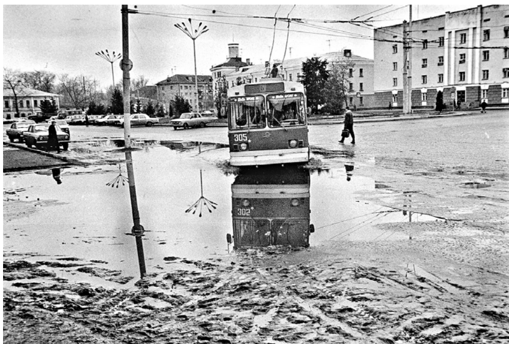
Привокзальная площадь. 1993 г.

В последнее время у всех на устах тема капитального ремонта многоквартирных домов. Люди возмущаются, а некоторые даже вычеркивают в платежках строку оплаты «за капитальный ремонт». Интересно, по какой причине? Многоквартирный дом — общая собственность, которую нужно содержать в чистоте и ремонтировать. Почему же наши граждане считают, что это нужно делать за счет государственных средств, хотя квартиры приватизированы или куплены, то есть находятся в собственности? Некоторые ссылаются на то, что квартира перешла в собственность в доме, уже требующем