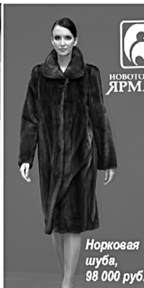
Норковая шуба, 98 000 руб.