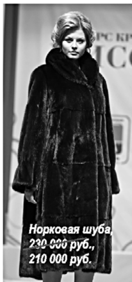
Норковая шуба, 230 000 руб., 210 000 руб.

Изготовление Новоторжской норки - это целое искусство. Современные технологии потребуют не менее двух недель на пошив одного изделия! Для изготовления манто из 35 норок наборщик меха сортирует более 500 шкурок, прежде чем подберет однородные по ворсу. Результат кропотливой работы - красивые норковые шубы по выгодной цене на Новоторжской ярмарке.