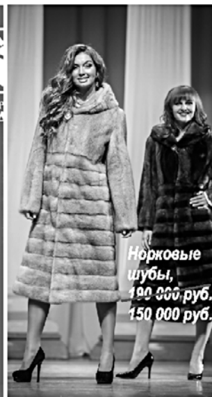
Норковые шубы, 190 000 руб., 150 000 руб.