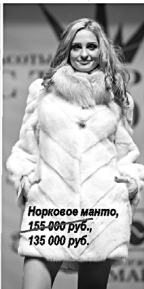
Норковое манто, 155 000 руб., 135 000 руб.