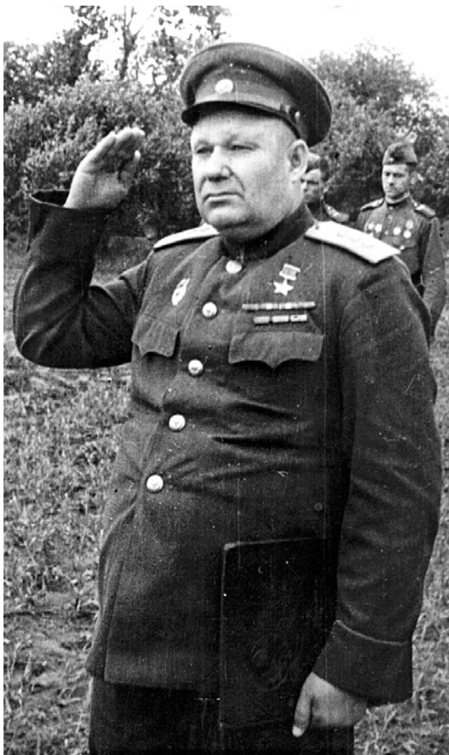
Генерал-полковник Михаил Степанович Шумилов. 1944 г.