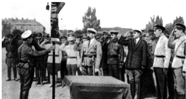
М. Фрунзе награждает героев штурма Перекопа. 1921 г.