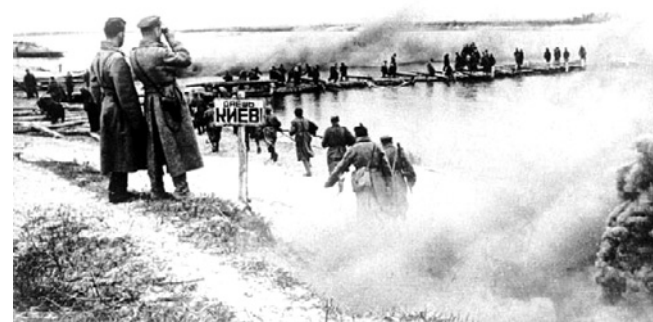
Переправа через Днепр. 1943 г.

Память о легендарном генерале бережно хранится в нашей стране. Ему установлены памятники в Волгограде и Кургане. Именем Шумилова названы улицы в Белгороде, Москве, Волгограде, Катайске, Кировограде, Минусинске, Шадринске. В Светлоярском районе Волгоградской области его именем названа школа. Он является почетным гражданином Белгорода, Москвы, Волгограда, Бельцов, Братиславы, Шебекино, села Верхтченского... А кубок генерала Шумилова – ежегодный турнир между командами регби Белгорода и Волгограда.