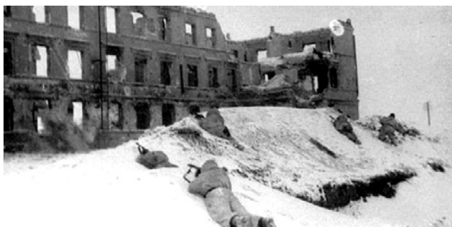
Бойцы 64-й армии ведут бой за дом в одном из районов Сталинграда. 1942 г.

Особенность боевого почерка командарма Шумилова состояла в том, что он умел в нужный момент сосредоточить основные силы армии на ведущем направлении для решения главной задачи. А для этого нужно было всегда иметь резервы. Те, кто воевали с ним бок о бок всю Сталинградскую битву, выделяли в своем командире не только полковод-