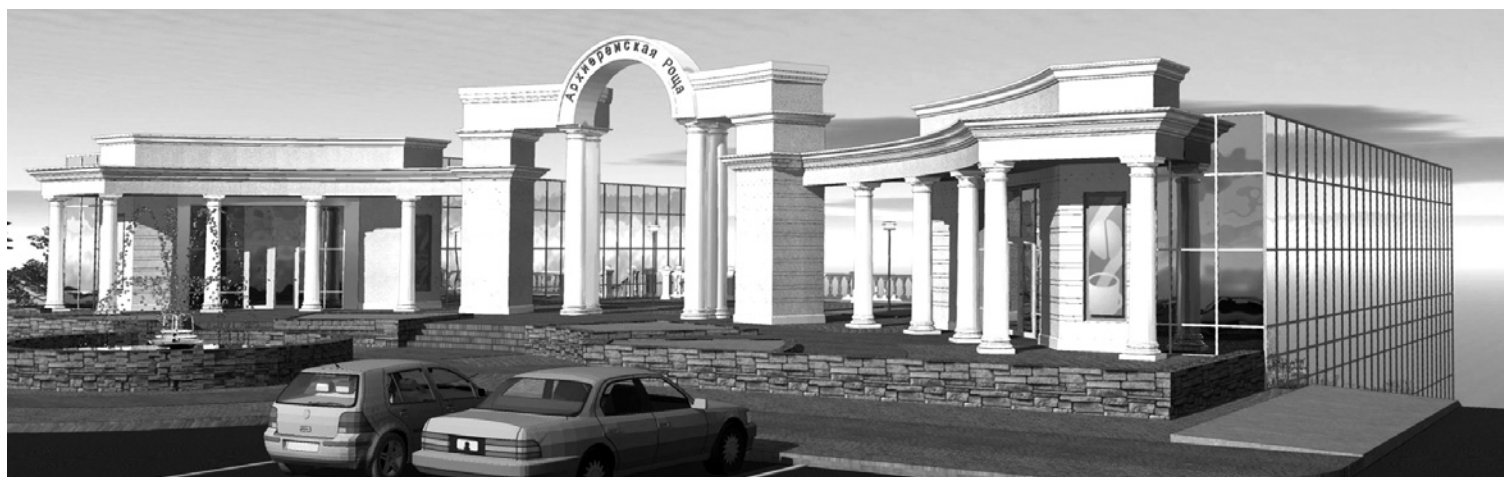
Проект центрального входа в парк.

Проект благоустройства Архиерейской рощи, принятый за основу в сентябре, вызвал у горожан неоднозначную реакцию. Одни усмотрели в нем серьезные изъяны. Другим он пришелся по душе. «Семь раз отмерь – один отрежь», - гласит народная мудрость. Остается надеяться, что пока одни «меряют», другие не начнут «резать».