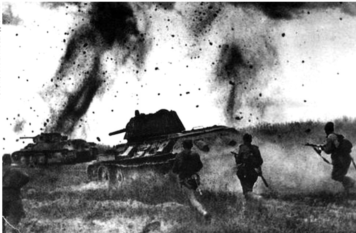
Танки Т-34-76 поддерживают атаку пехоты.

Курская битва началась для меня 6 июля. Наш танковый взвод был в засаде, когда прямо на нас двинулась вражеская моторизованная колонна. Впереди на мотоциклах шла разведка. Её мы пропустили, зато по основным силам открыли огонь. Подбили пять «тигров», уничтожили до роты пехоты, несколько орудий. Очень скоро состоялся и мой самый тяжёлый за всю войну бой. В районе Яковлево немецкие дивизии прорвали оборону советских войск. Нашу бригаду бросили наперерез трём немецким дивизиям. Перевес сил был у противника – 63 советских танка против 500 вражеских. С само-