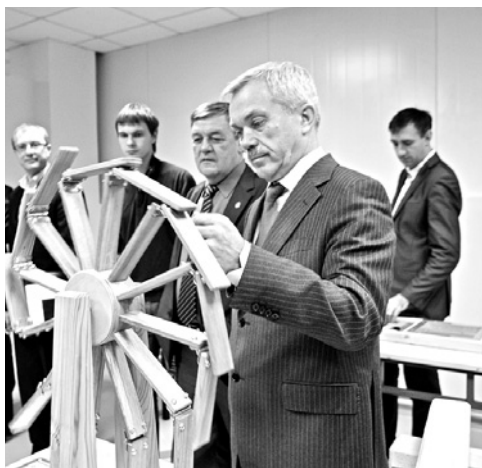
Открытие музея занимательных наук. Белгород, 4 апреля 2012 год.

раскулачена, и девушке пришлось хлебнуть горя, скрываясь до совершеннолетия у чужих людей.