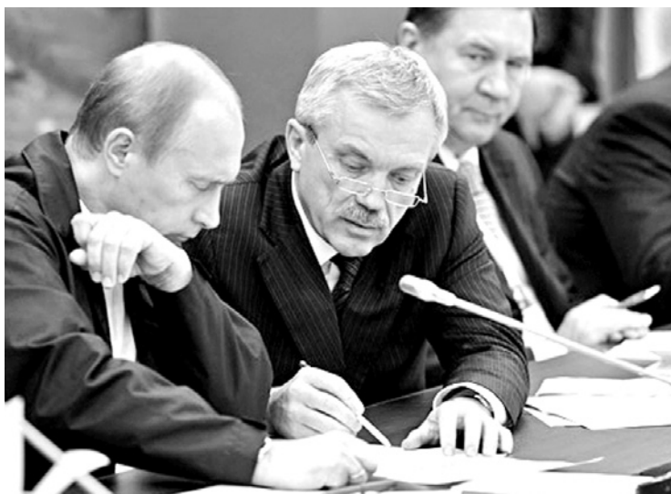
На совещании по развитию животноводства. Москва, 5 июня 2009 год.

В жизни каждой страны, региона, города, человека есть важные вехи, особые даты, оглядываясь на которые, мы даем оценку пройденному пути, анализируем достигнутое. Одна из таких дат была вчера, 11 октября 2013 года: ровно 20 лет назад руководство Белгородской областью принял на себя Евгений Степанович Савченко. Из нынешних губернаторов ни один не находился на своем посту столь длительный срок. Это абсолютный рекорд для России.