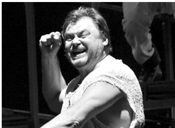
Сцена из спектакля "На дне"