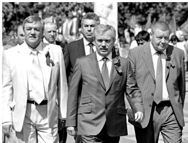
На главном празднике отечества. Белгород, 9 мая 2012 год.