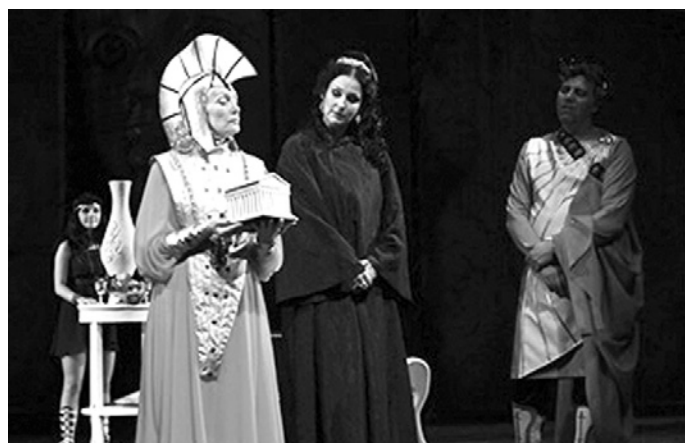
Сцена из спектакля "...Забывать Герострата!"

В Белгороде проходит IX Всероссийский театральный фестиваль «Актеры России – Михаилу Щепкину».