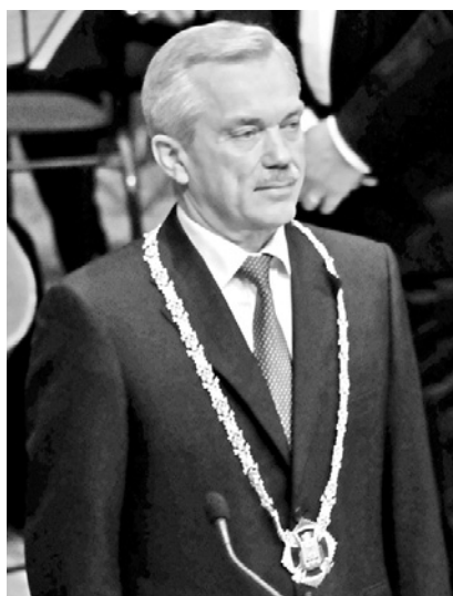
Вступление в должность губернатора области. Белгород, 20 октября 2012 год.