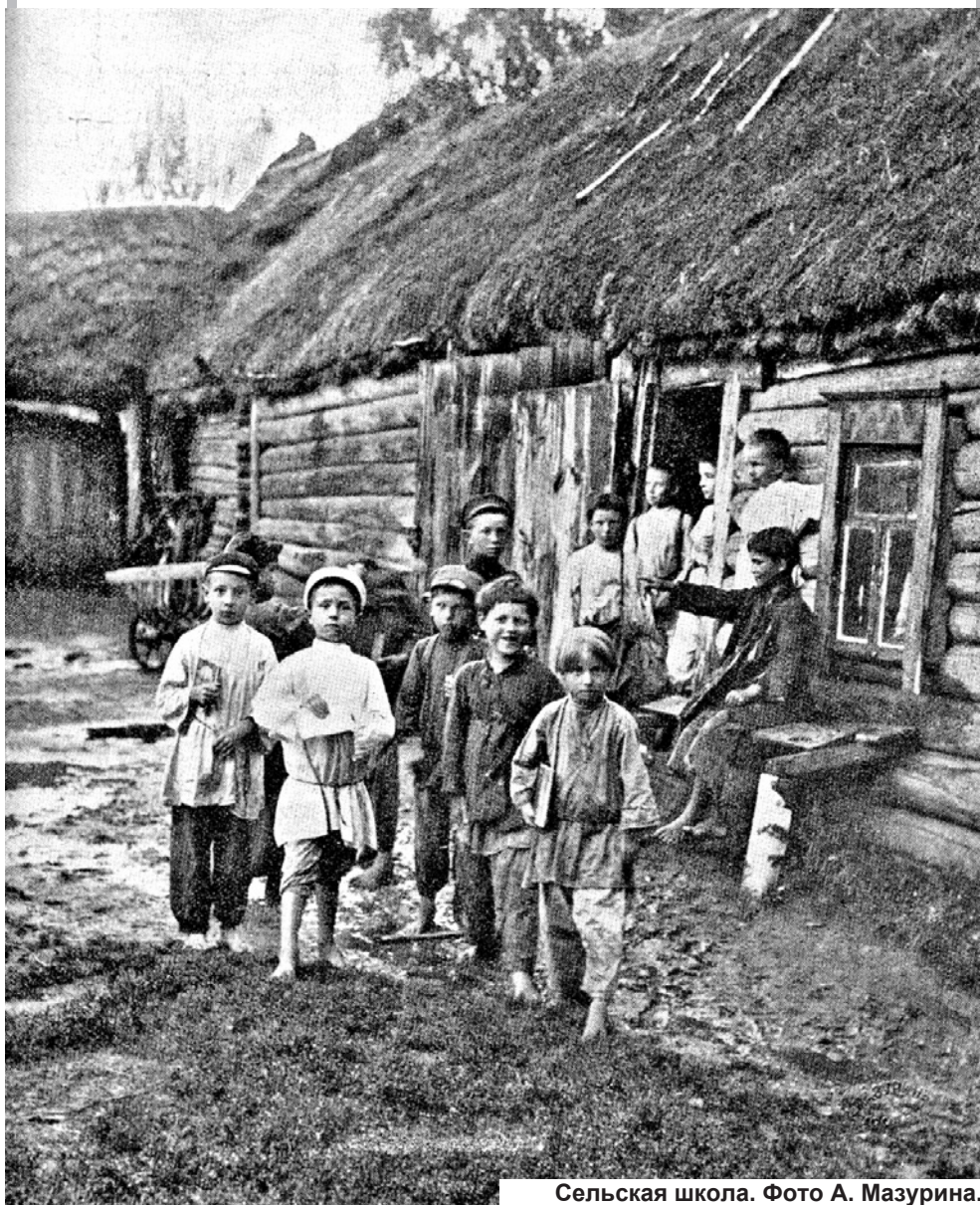
Сельская школа.

Современного человека невозможно представить не умеющим писать и читать, а ведь всеобщее обязательное образование в нашей стране было введено только в XX веке. Но идея эта зародилась уже после отмены в 1861 году крепостного права, только путь к ее осуществлению оказался долгим и непростым.