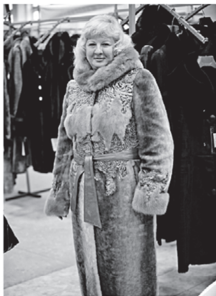
Торговый ряд «Мутон «Дольче Вита», от 35 до 62 тыс. руб.

Для тех, кто готов купить натуральную шубу не более, чем за 18 тысяч рублей от Новоторжской ярмарки есть торговый ряд «Шубы до 18 тысяч рублей!» Это красивые, теплые и удобные изделия из мехового лоскута. В дни ярмарки на женские мутоновые шубы и дубленки с красным ценником действует скидка 10000 рублей. Например, если шуба стоила 35 тысяч рублей, по выгодному предложению вам она обойдется за 25 тысяч рублей.