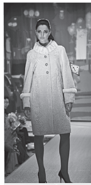
Торговый ряд «Овчина премиум «Уроки французского», от 27 980 до 39 980 руб.