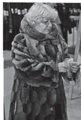
Торговый ряд «Шубы до 18 тыс. руб.»