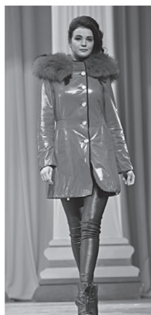
Торговый ряд «Огни большого города», от 42 до 46 тыс. руб.