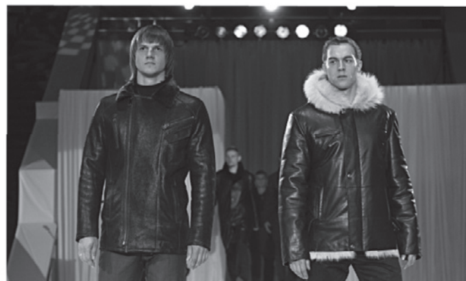
Торговый зал «Для мужчин», от 27 980 до 57 980 руб.

изделий из овчины от Новоторжской ярмарки - от 27 980 до 57 980 рублей. Действует выгодное предложение для мужчин - «Скидка 10 000 рублей!». Так, мужскую дубленку «Канзас» за 37 980 вы купите за 27 980 рублей.