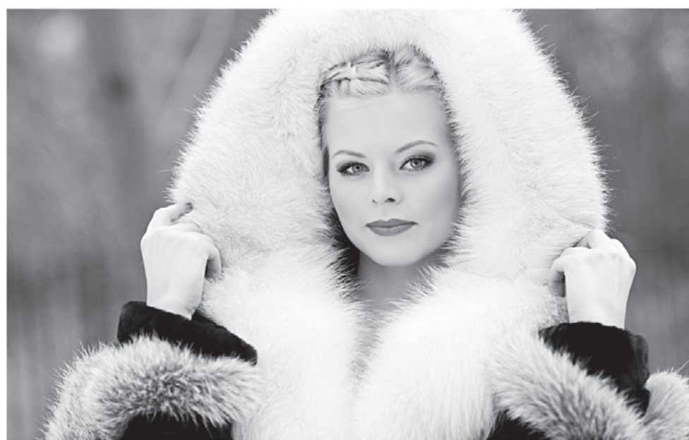
Торговый ряд «Жюли» - мутон с пушиной, от 35 до 62 тыс. руб.

Сильный пол тоже хочет быть красивым и модным! В этом сезоне Новоторжская ярмарка приготовила новую коллекцию шуб и дубленок для мужчин. Эти меховые изделия великолепно сидят, подходят для любого возраста, статуса и эстетических предпочтений. В ряду «Классика для мужчин» вы купите куртки, полупальто и длинные пальто классических силуэтов. Все из натурального меха. Классические силуэты делают мужчин стройнее. Изделия удобные, теплые и легкие. Размеры - от 46 до 62. Мода для мужчин - дубленки из особо тонкой овчины, тосканы, мехового велюра, овчины премиум. В моделях этого ряда сделан акцент на элегантность и моду. Цена мужских