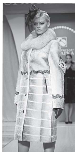
Торговый ряд «Мутон» от 19 980 до 35 980 руб.