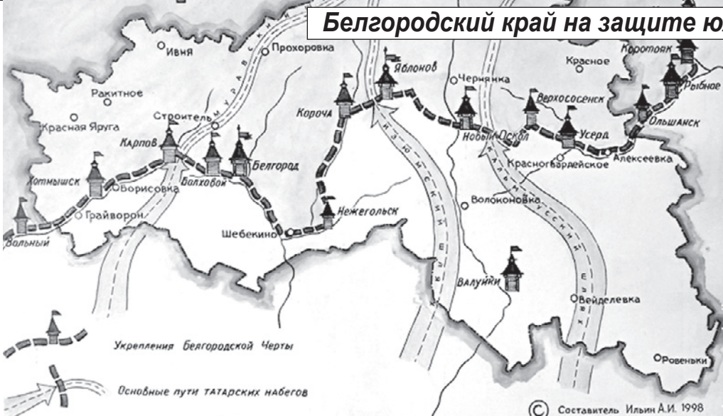
Белгородский край на защите южных рубежей

Войска Белгородского разряда участвовали в русско-польской войне 1654–1667 годов. Воевали против гетманов Ивана Брюховецкого и Петра Дорошенко в 1668–1669 годах, в русско-турецкой войне 1673–1681 годов, в крымских и азовских походах. Неоднократно Белгородский разряд получал «благодарственное слово» от царей Алексея Михайловича и Петра I.