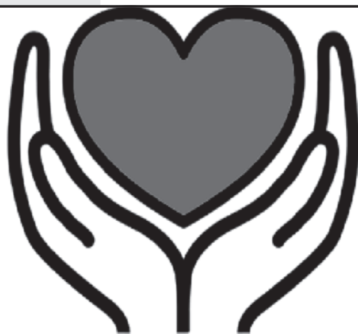
Публикацию на платной основе разместило Региональное отделение в Белгородской области Политической партии «Гражданская платформа».

Не желая мириться с существующим положением вещей, мы, партия «Гражданская платформа», предлагаем всем соотечественникам объединиться для реализации проекта эволюционного развития нашего общества и государства. Мы убеждены, что для реализации такого проекта у нашей страны есть все необходимые ресурсы и, прежде всего, люди, объединенные ценностями свободы и справедливости. Мы твердо убеждены в базовом принципе демократии: не человек призван служить власти, а власть – человеку. Этот принцип будет взят за основу государственной политики в любой сфере. Будущее России должно строиться на равноправии и взаимной ответственности государства и гражданина, верховенстве закона, безусловном уважении частной собственности, принципов светского государства и соблюдении прав человека.