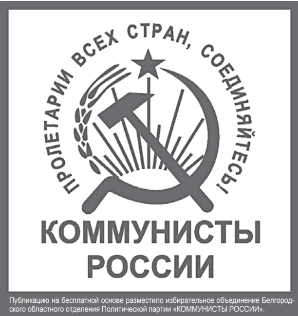
Публикацию на бесплатной основе разместило избирательное объединение Белгородского областного отделения Политической партии «КОММУНИСТЫ РОССИИ».

С 12 августа 2013 года будет организовано функционирование телефонов «ГОРЯЧЕЙ ЛИНИИ» во всех участковых избирательных комиссиях (по рабочим дням с 12 августа по 7 сентября 2013 года - с 09-00 до 18-00 часов, 8 сентября 2013 года - с 08-00 до 24-00 часов).