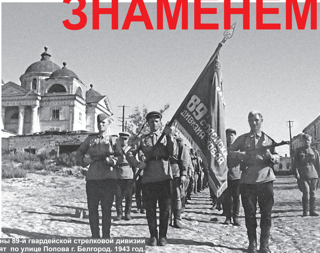
Воины 89-й гвардейской стрелковой дивизии проходят по улице Попова г. Белгород. 1943 год.

5 августа - большой и светлый праздник для белгородцев – и тех, кто уцелел после двадцати месяцев оккупации, угона на принудительные работы в Германию, жизни во фронтовом городе, вернувшихся после войны и восстанавливавших разрушенный Белгород, кто в послевоенное время приумножил славу города, и поколения нынешнего, хранящего генетическую память своих предков.