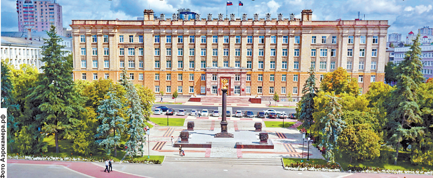
2013. Соборная площадь, стела «Белгород – город воинской славы»

Это событие сыграло ключевую роль в мировой истории. Война покатила на запад, а мир получил все предпосылки того, что фашистская чума будет уничтожена. До окончания Второй мировой войны оставалось еще немало тяжелых дней и ночей, но коренной перелом в нее был внесен именно здесь – под Орлом и Белгородом. Семьдесят лет назад. Сегодня в живых осталось совсем немного тех, кто сражался на рубежах Великой Отечественной. Людской век короток, но память живет в веках.