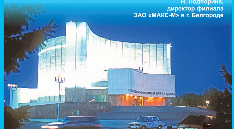
Лицензия ФССН С №2226 77