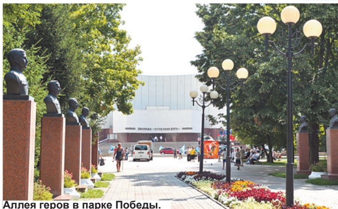
Аллея героев в парке Победы.

Узнать много познавательного об истории Белгородчины можно в историко-краеведческом музее. О народной жизни расскажут экспозиции музея на-