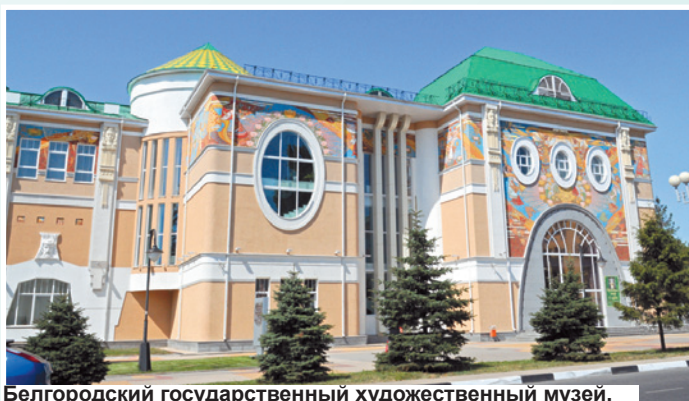
Белгородский государственный художественный музей.

родной культуры. Познакомьтесь с выставками белгородских и приезжих художников гости города могут в выставочном зале «Родина» и Белгородском государственном художественном музее. Новое здание худмузея является одним