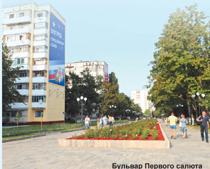
Бульвар Первого салюта