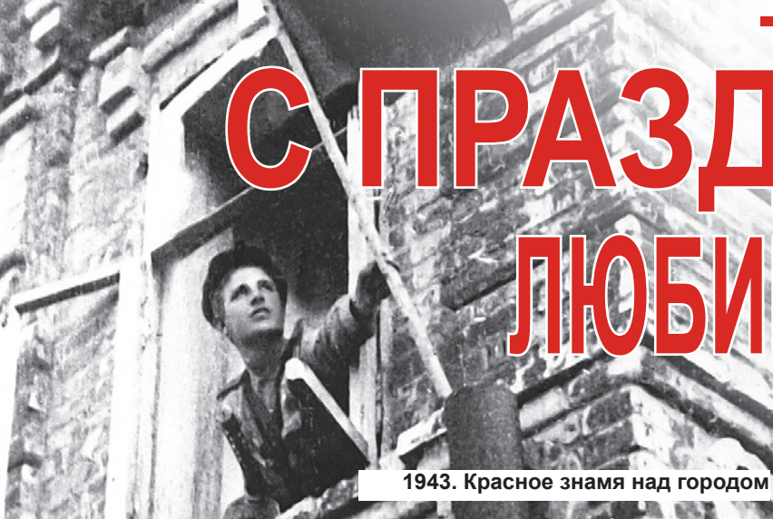
1943. Красное знамя над городом