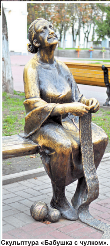
Скульптура «Бабушка с чулком».

Особую прелесть придают белгородским улицам и