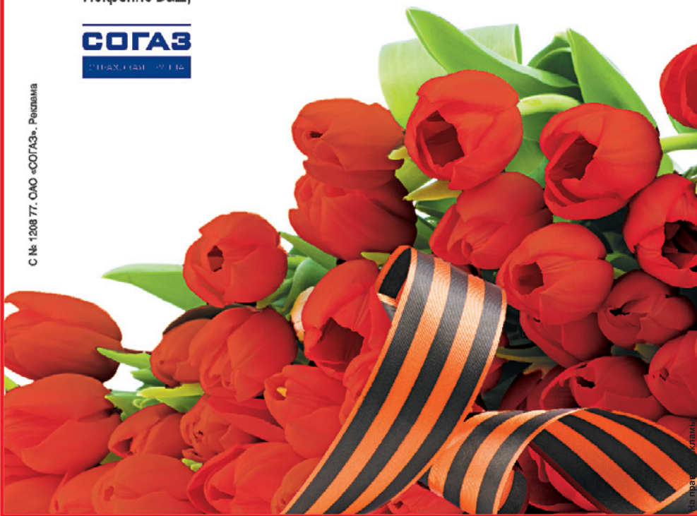
С № 1208 77-ОМО «СОГАЗ». Рязань