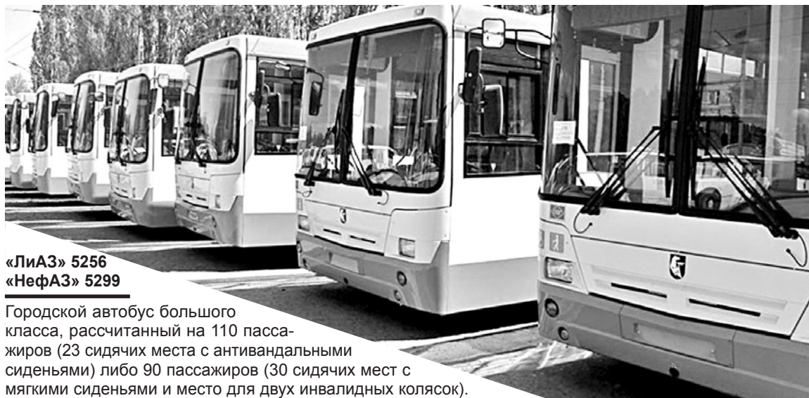
«ЛиАЗ» 5256 «НефАЗ» 5299

к четвертому поколению электротранспорта. Эти машины получили заслуженное признание не только в России, но и ряде стран Евросоюза. Троллейбусы «Витовт» весьма экономичны. Они имеют прекрасные эксплуатационные характеристики и удобны как для пассажиров, так и для водителей».