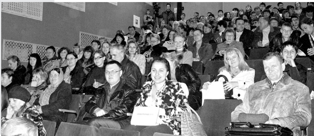
Учатся члены участковых избирательных комиссий.

В 2012 году произошли значительные изменения в избирательном законодательстве. Изменения коснулись установления единого дня голосования, порядка применения пропорциональной или мажоритарной избирательных систем на муниципальных выборах, образования избирательных округов, избирательных участков, сроков полномочий и порядка формирования участковых комиссий.