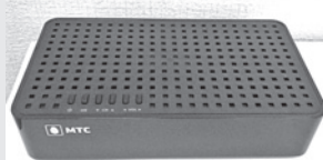
Так выглядит цифровой приемник.

Городской круглосуточный телеканал «Белгород 24» запущен в Белгороде 21 ноября.