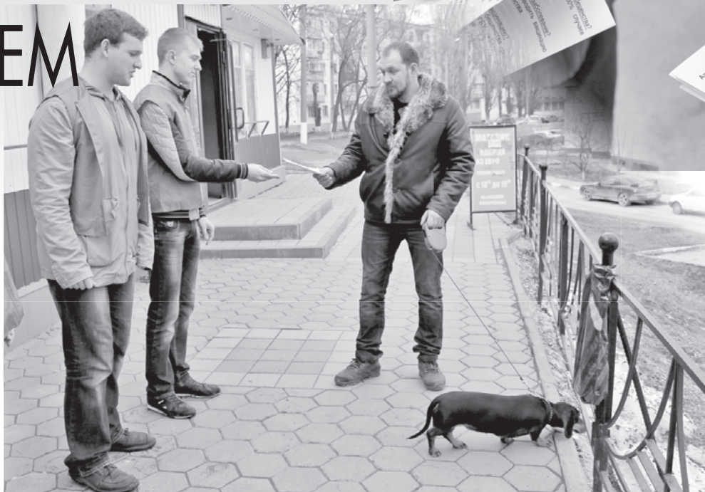
руках мы патрулировали дворы по улицам Некрасова и Садовая.

В день, когда работала моя группа, в городе их было всего пять. По приблизительным подсчетам, они должны были охватить до пятидесяти дворовых территорий. Моей группе достался определенный «квадрат» местности, которым она будет заниматься не один день. С памятками в