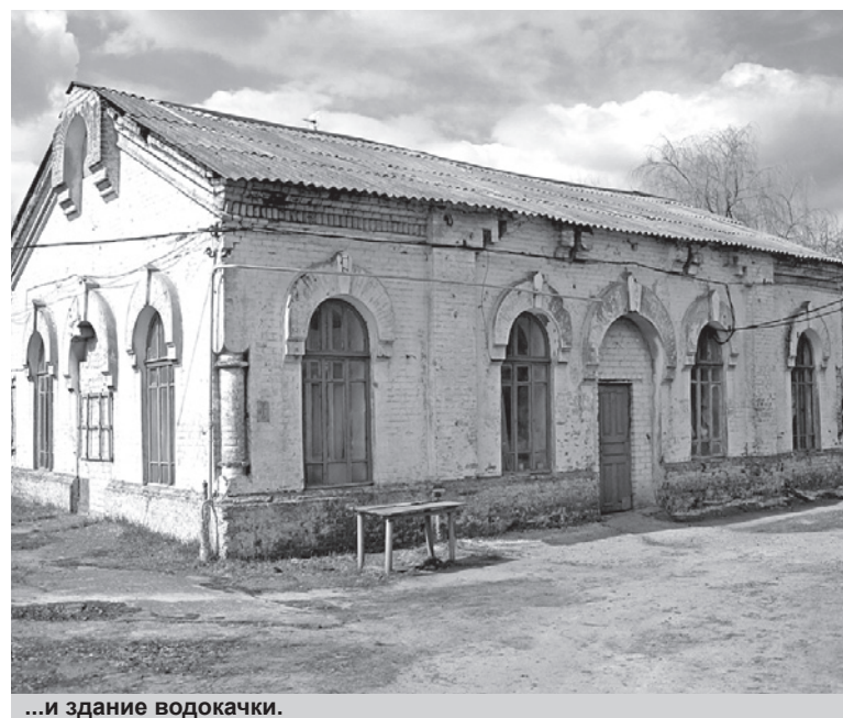
...и здание водокачки.