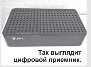
Так выглядит цифровой приемник.

Городской круглосуточный телеканал «Белгород 24» запущен в Белгороде 21 ноября.