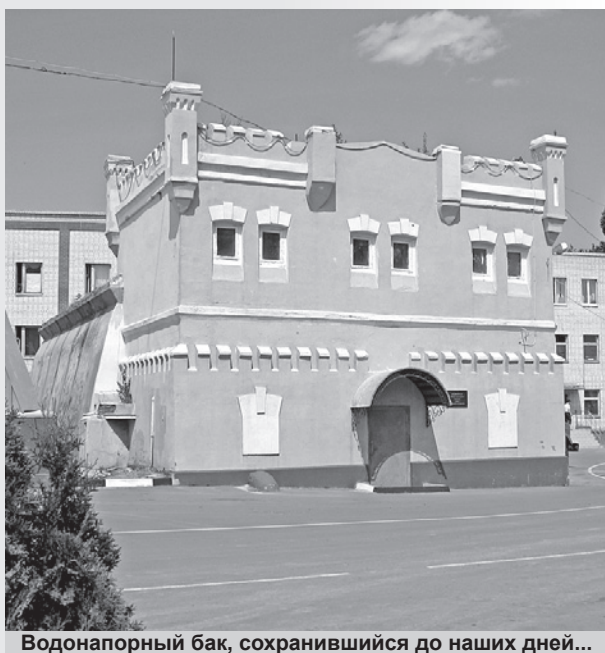
Водонапорный бак, сохранившийся до наших дней...

В документах городской управы за 1887 год впервые встречается стоимость воды из городского водопровода – 1/8 коп. за ведро. Но цена менялась, и уже в конце 1887 года по решению Думы плата за воду была увеличена с 1/8 до 1/6 коп. за ведро, при этом вода отпускалась бесплатно земской больнице, а также по льготной цене женскому монастырю и 31-й артиллерийской бригаде. Всего в течение 1888 года было отпущено 3 995 405 ведер воды, из них бесплатно - 191 429, по льготной цене - 339 500. Всего поступило в городскую кассу 6859 рублей 72 копейки, из них получено от водопоя скота 705 рублей, а расходы на содержание водопроводной сети составили 6809 рублей 72 копейки. Прибыли, как видим, от водопровода не было. В 1890 году из общественных водопроводных будок вода отпускалась уже по 1/4 коп. за ведро, а из водопроводных кранов домовладельцев – по 1/6 коп., суточный расход воды города составлял 10380 \frac{3}{4} ведра.