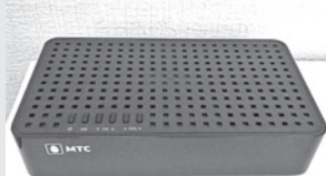
Так выглядит цифровой приемник.

Городской круглосуточный телеканал «Белгород 24» запущен в Белгороде 21 ноября.