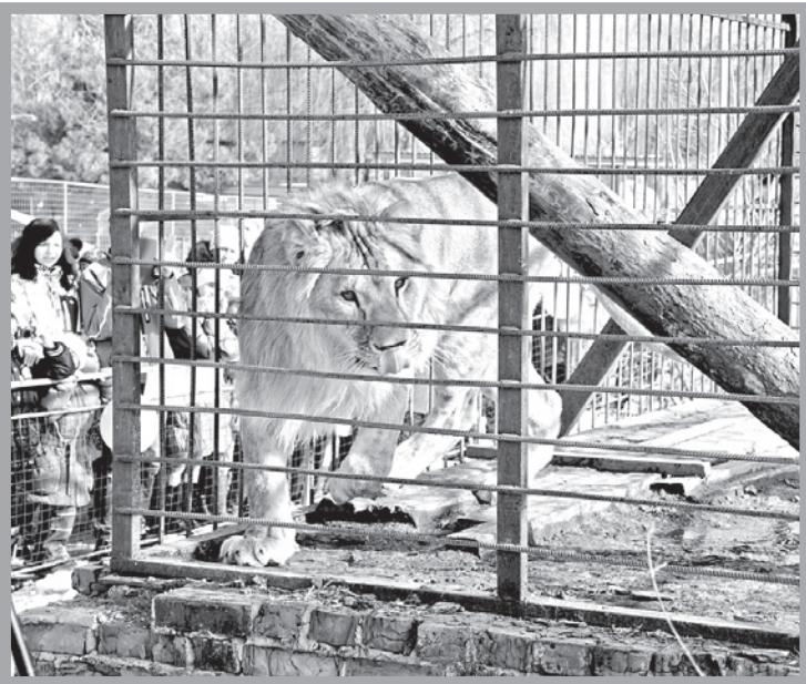
Лев с гордым именем Бонапарт (но все работники зоопарка нежно называют его Бони) приехал к нам в город в конце декабря прошлого года. После положенного карантина животное было представлено публике.

Один из вольеров в белгородском зоопарке украшен шариками. Десятки детей, радостных, покрасневших после активного участия в проводимых на входе конкурсах, хором кричат: «Бони, выходи». Бони – лев, и у него новоселье.