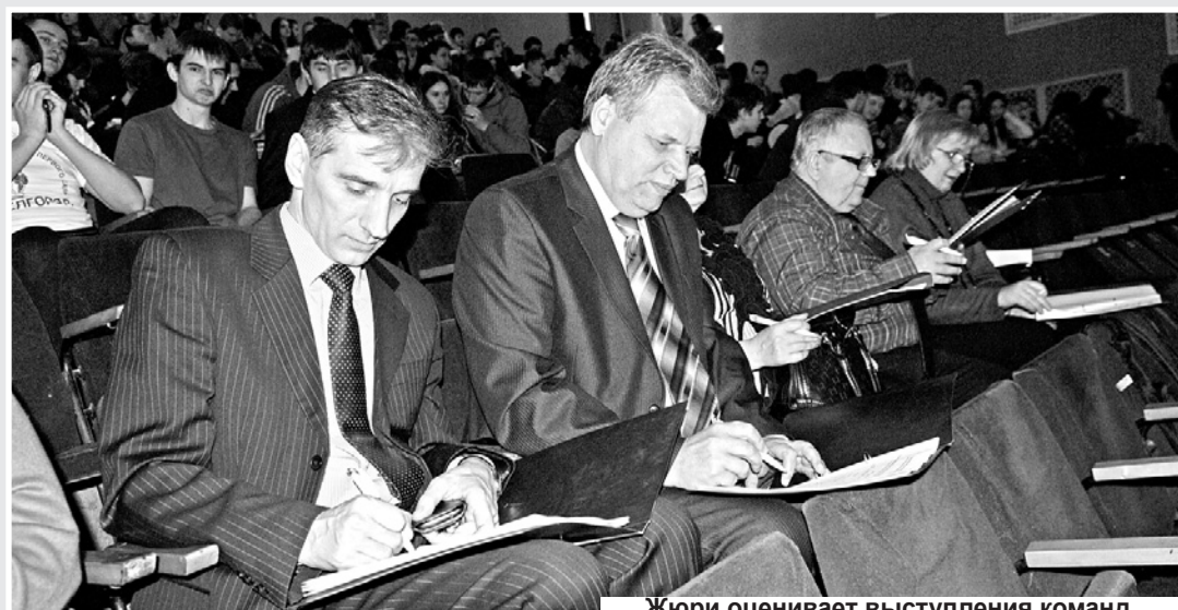
Жюри оценивает выступления команд.