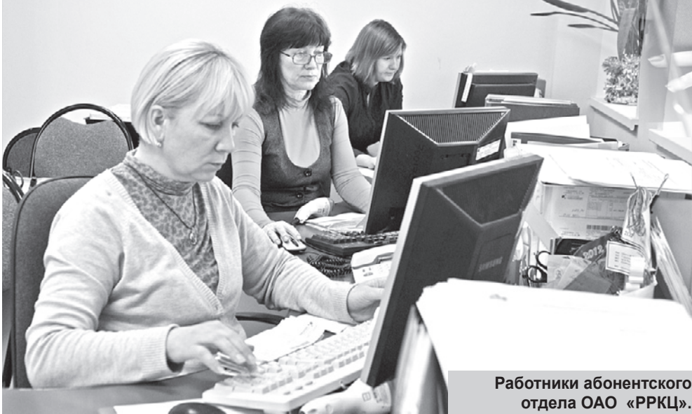
Работники абонентского отдела ОАО «РРКЦ».