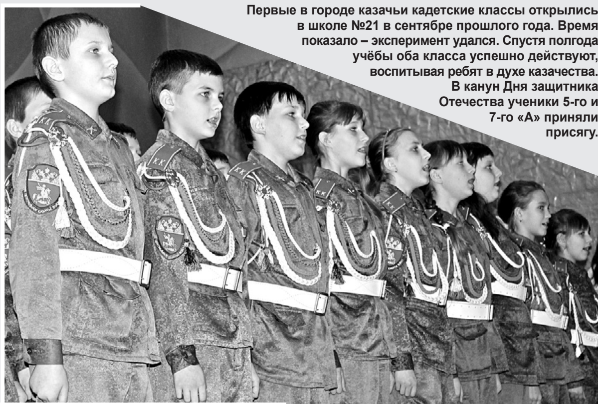
Материалы полосы подготовила Алёна Малко

Первые в городе казачьи кадетские классы открылись в школе №21 в сентябре прошлого года. Время показало – эксперимент удался. Спустя полгода учёбы оба класса успешно действуют, воспитывая ребят в духе казачества. В канун Дня защитника Отечества ученики 5-го и 7-го «А» приняли присягу.