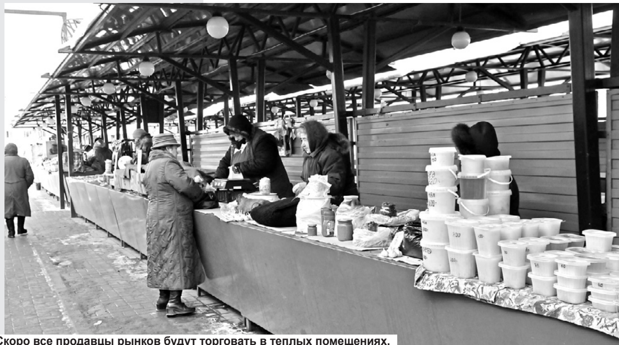
Скоро все продавцы рынков будут торговать в теплых помещениях.