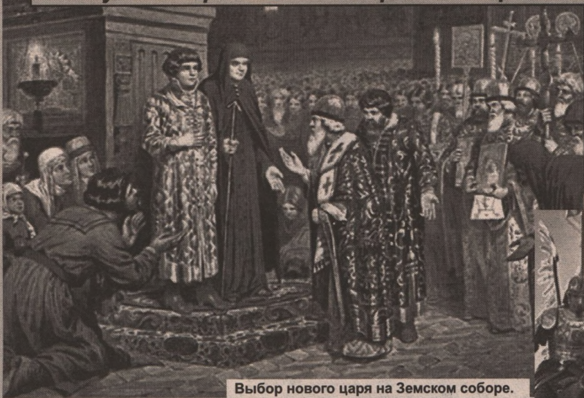
Выбор нового царя на Земском соборе.

О Смутном времени в истории белгородского края