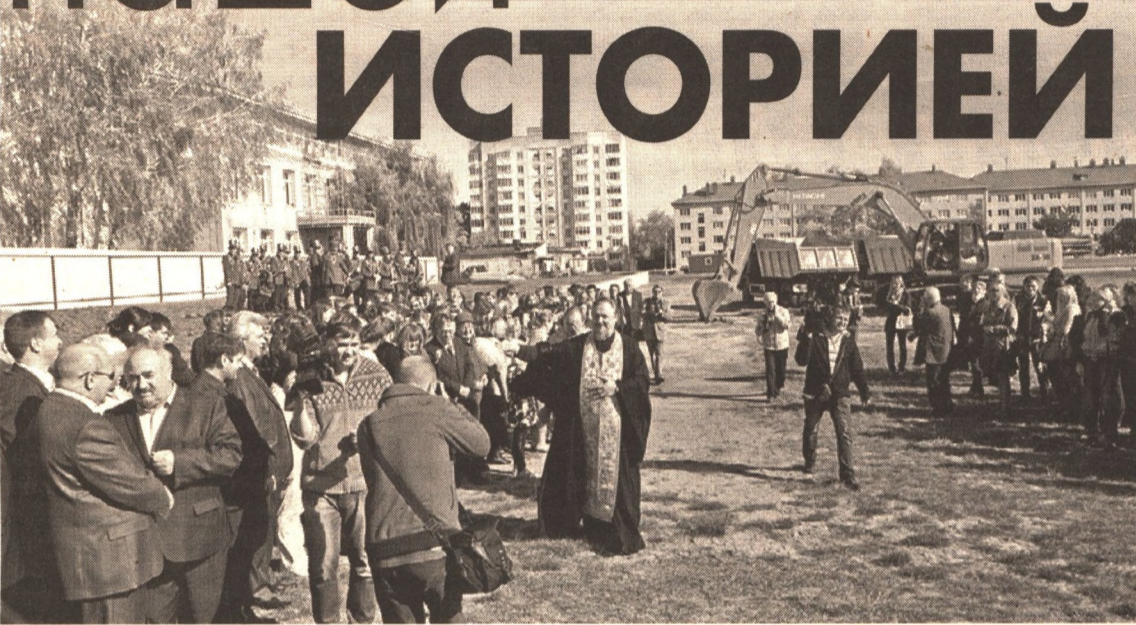
Почётные гости университета на церемонии закладки нового общежития.

премии. Год назад здесь был установлен памятник писателю Ивану Бунину. По задумке руководителя Белгородского госуниверситета у здания старого корпуса НИУ «БелГУ» в скором времени должна появиться аллея русских писателей, лауреатов Нобелевской премии.