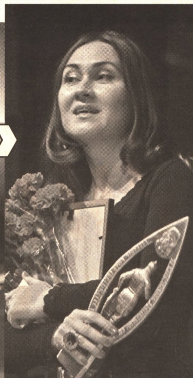
Самым волнующим моментом церемонии, конечно же, стало награждение лауреатов. Главный приз достался серб-