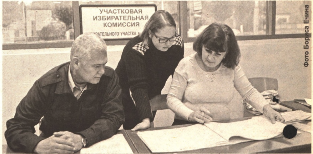
В день выборов, 14 октября, откроет свои двери новый избирательный участок № 60, расположенный в торговом центре «Спутник-Урожай».

поступило лишь одно заявление на нарушение предвыборной агитации. На 178 участках будет осуществляться видеонаблюдение за ходом выборов. Из них на 173 участках обеспечена трансляция в онлайн режиме. На остальных это сделать невозможно в связи с низкой скоростью передачи данных по Интернету. Для того чтобы наблюдать за ходом выборов по сети, следует заблаговременно зарегистрироваться на сайте www.vybory-2012.ru .