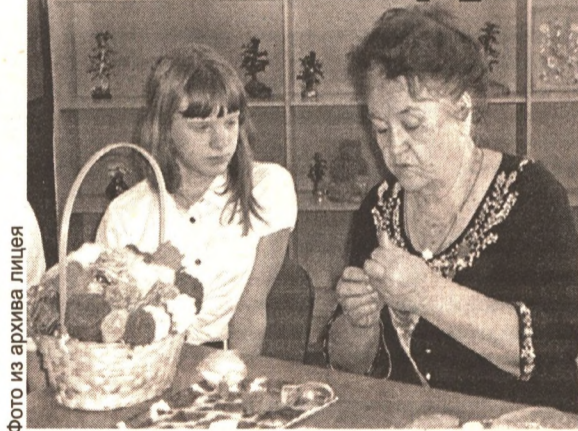
фото из архива лицея