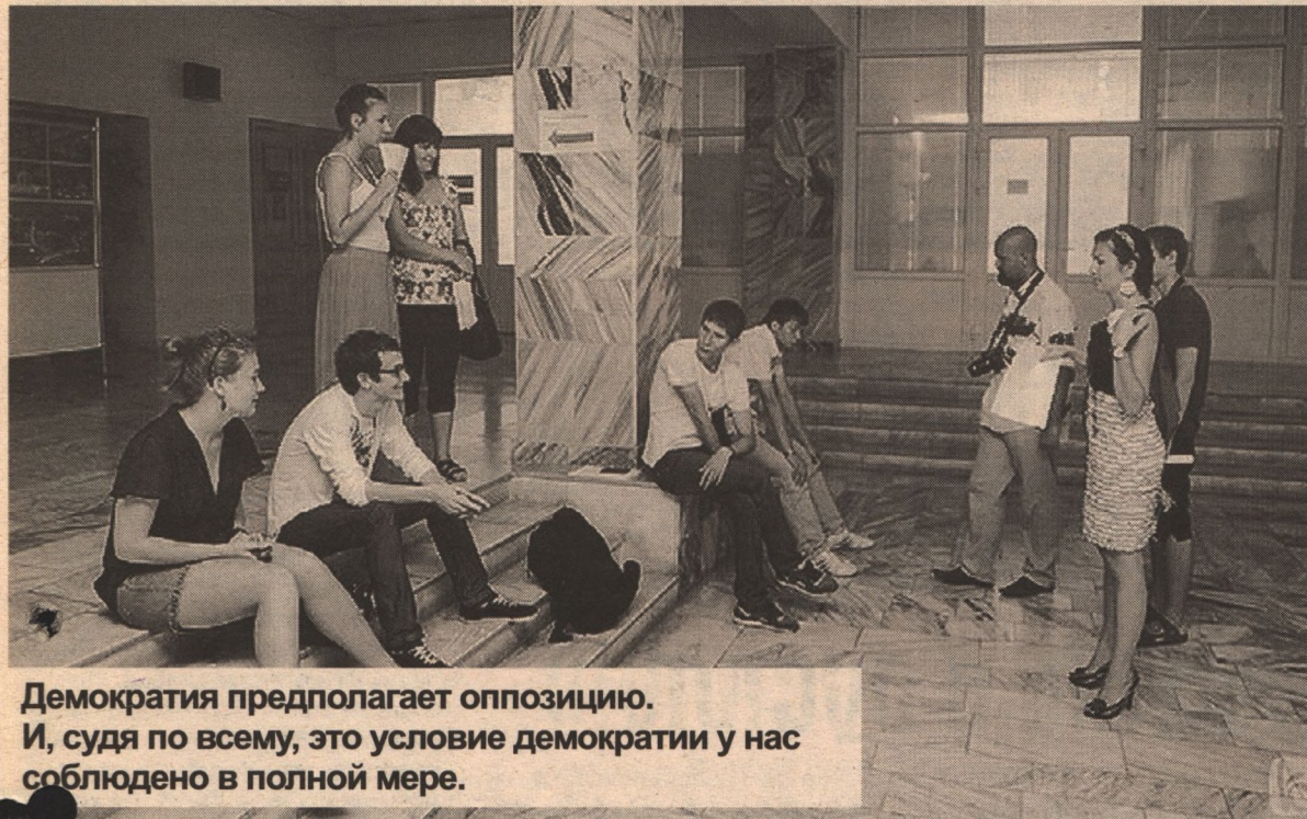
Демократия предполагает оппозицию. И, судя по всему, это условие демократии у нас соблюдено в полной мере.

Перед президентскими выборами оппозиция в России особо разгулялась, проведя акции под многообещающим названием «Марш миллионов». Недобор численности их участников компенсировался хулиганскими выходками с нанесением вреда здоровью и имуществу граждан. А поскольку демократическое государство — это еще и правовое государство, то власть отреагировала адекватно — не репрессиями, а принятием закона. В Кодекс об административных правонарушениях и закон «О собраниях, митингах, демонстрациях, шествиях и пикетированиях» были внесены поправки, значительно ужесточившие наказания за организацию беспорядков. Причем закон понятное дело, един для всех — как для сторонников существую-