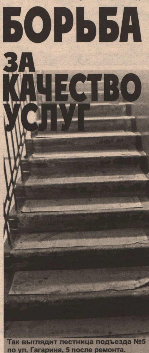
Так выглядит лестница подъезда №5 по ул. Гагарина, 5 после ремонта.

тельство, приводит перечень работ, входящих в плату за содержание жилья: