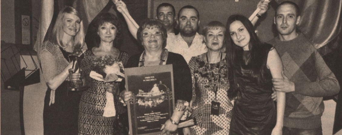
Белгородский театр кукол закрыл 46-й сезон