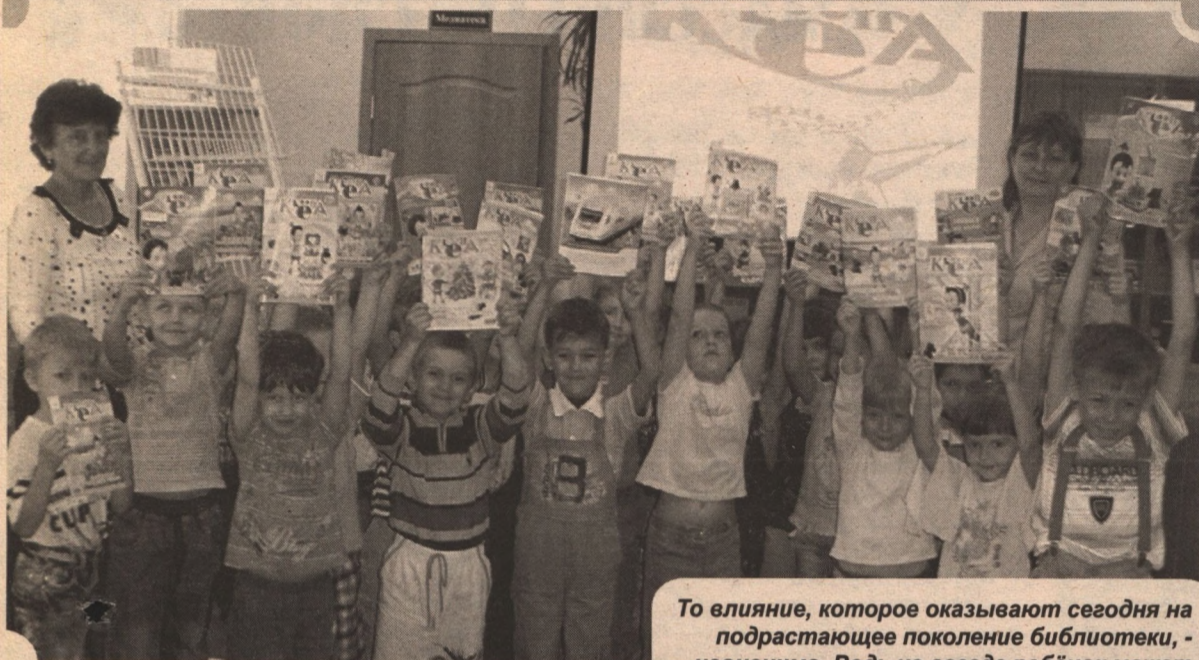
То влияние, которое оказывают сегодня на подрастающее поколение библиотеки, - не переоценить. Ведь не всегда ребёнок может сориентироваться в огромном потоке издаваемой в наши дни литературы. А книга является незаменимым помощником в развитии детей. И важно, чтобы встреча с ней произошла как можно раньше, с самого нежного дошкольного возраста.

Библиотекари на прошлой неделе отметили свой профессиональный праздник.