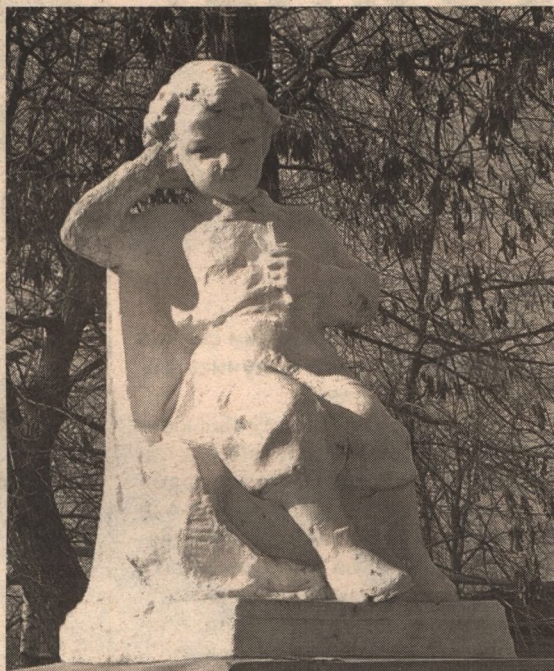
Типичный образец советской скульптуры середины 20 века

Не могу не согласиться с тем, что всевозможные цари и фараоны – это, конечно же, политики, но замечу, что если эти деятели являются авторитетами для верных ленинцев, то это, по меньшей мере, странно, учитывая беспощадную и жестокую борьбу Ленина с самодержавием.