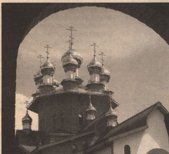
«СВЯТЫЕ КУПОЛА» Александр Бабицкий

Мы продолжаем публиковать работы участников нашего конкурса «Белгород глазами горожан». И ждём ваши новые фотографии по адресу nashbel@belnovosti.ru