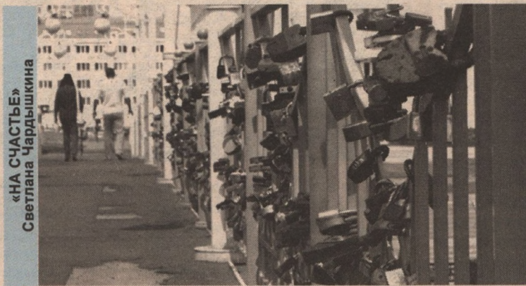
«НА СЧАСТЬЕ» Светлана Чардышкина