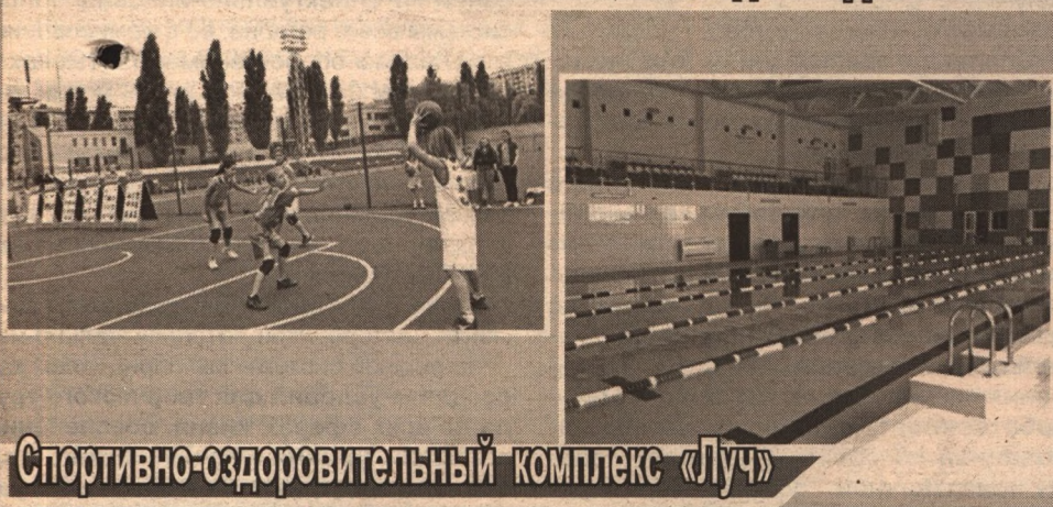
Спортивно-оздоровительный комплекс «Луч»

ки, где с удовольствием занимаются ребята из соседних дворов: всего в 2011-2012 годах в рамках марафона запланированы строительство, реконструкция и благоустройство 27 спортивных площадок на 27 территориях города. В Южном микрорайоне введён в эксплуатацию спортивно-оздоровительный комплекс «Луч» с бассейном.