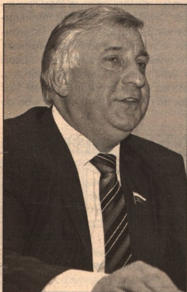
Георгий Голиков, депутат Государственной Думы Федерального Собрания Российской Федерации