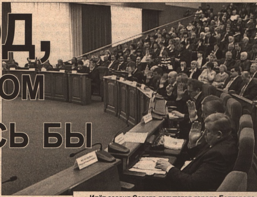
Идёт сессия Совета депутатов города Белгорода