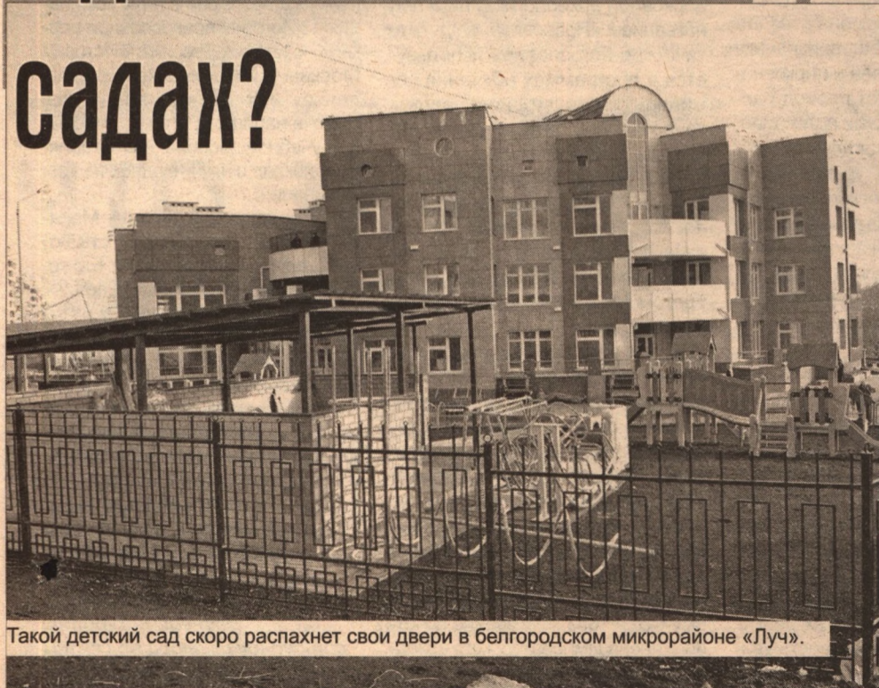
Такой детский сад скоро распахнет свои двери в белгородском микрорайоне «Луч».

Беседовала Мария Скокова