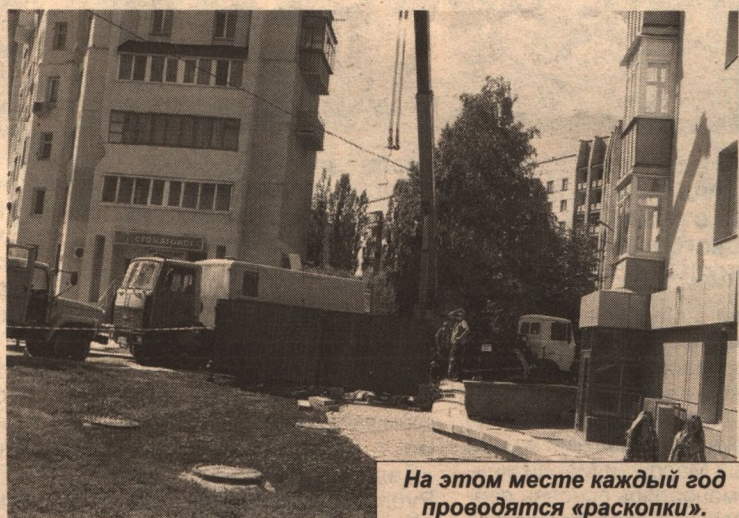
На этом месте каждый год проводятся «раскопки».