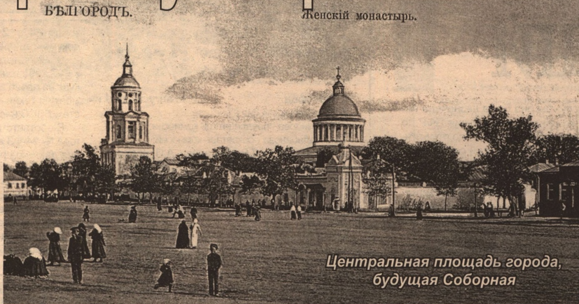
Центральная площадь города, будущая Соборная

Осенью 1766 года вступивший в должность новый губернатор Андрей Фливерк писал в рапорте императрице: «Непрременно надле-