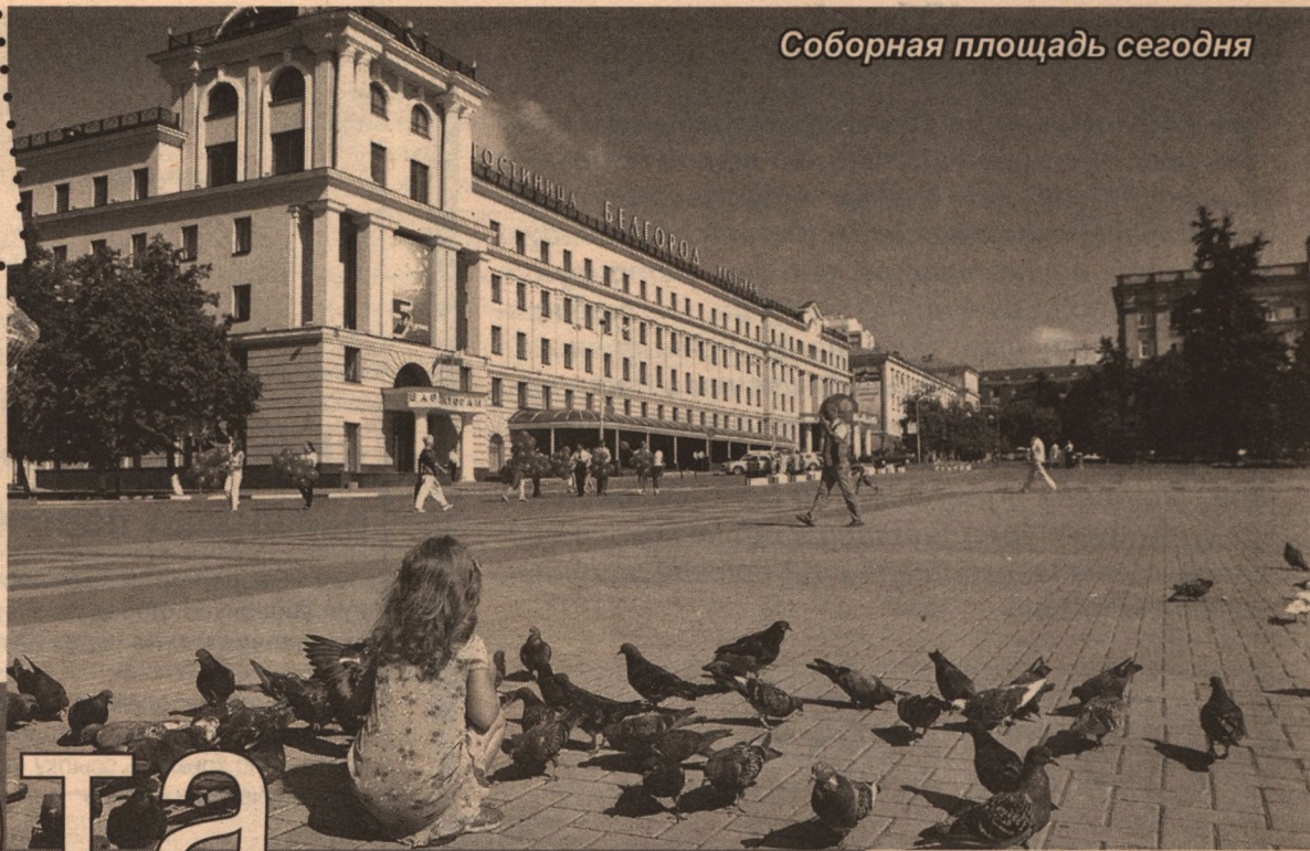
Соборная площадь сегодня

жит быть здесь архитектору, которого в здешнем месте не имеется, а сочинитель того плана артиллерийский офицер, архитектурного искусства знать не может». План с регулярной планировкой улиц был разработан и подписан 18 апреля 1767 года. Подпись архитектора неразборчива, но, возможно,