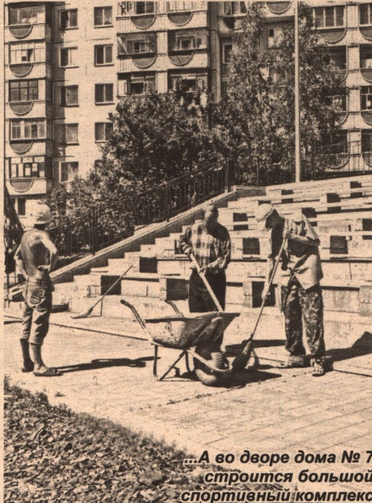
...А во дворе дома № 7 строится большой спортивный комплекс

– Да, это так. Поэтому я с удовольствием отвечу на поставленный вопрос. Сам стадион рассчитан на тысячу посадочных мест. Игровое футбольное поле здесь будет с естественным травяным покрытием, предусмотрена система автоматического полива. И освещаться в сумер-