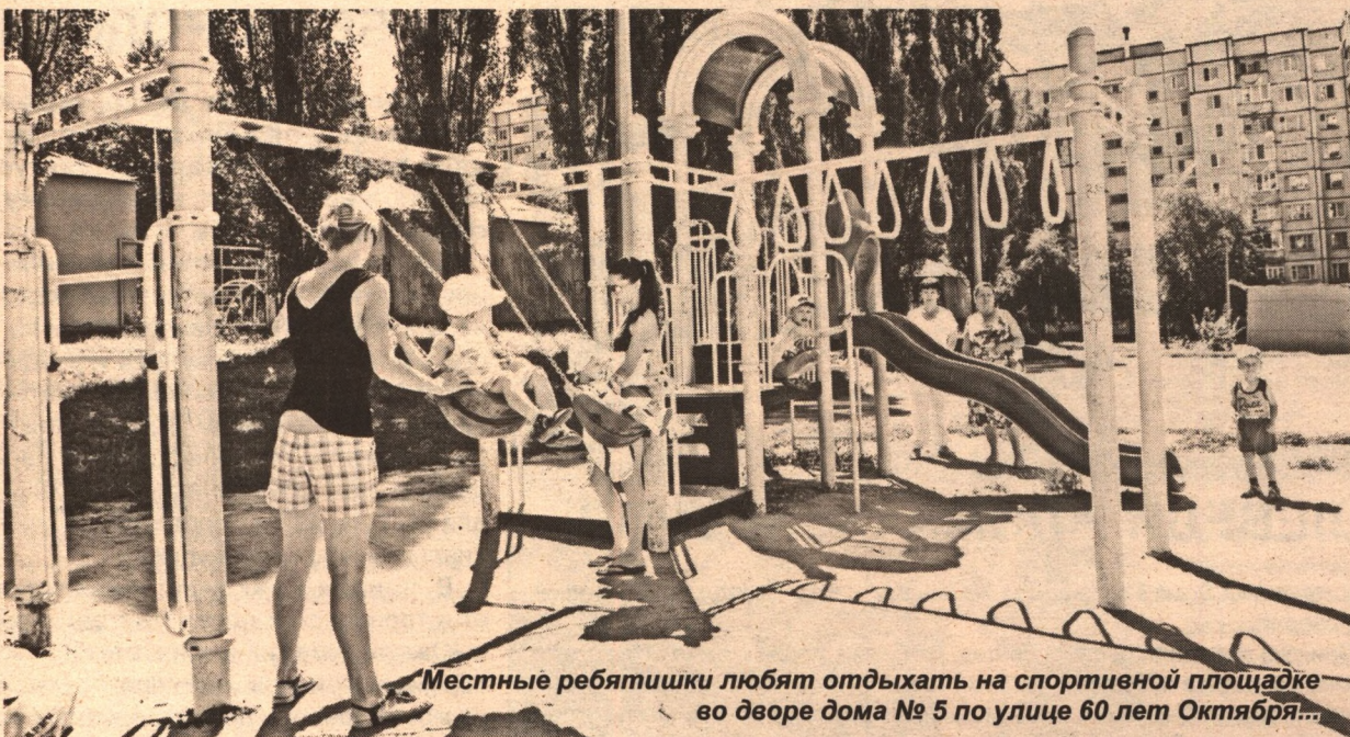
Местные ребятишки любят отдыхать на спортивной площадке во дворе дома № 5 по улице 60 лет Октября...

В прошлом году ряд трудовых коллективов города выступили с инициативой провести в областном центре благотворительный марафон «Спортивный двор» и перечислить на его счет однодневный заработок (оказать спонсорскую или адресную помощь).