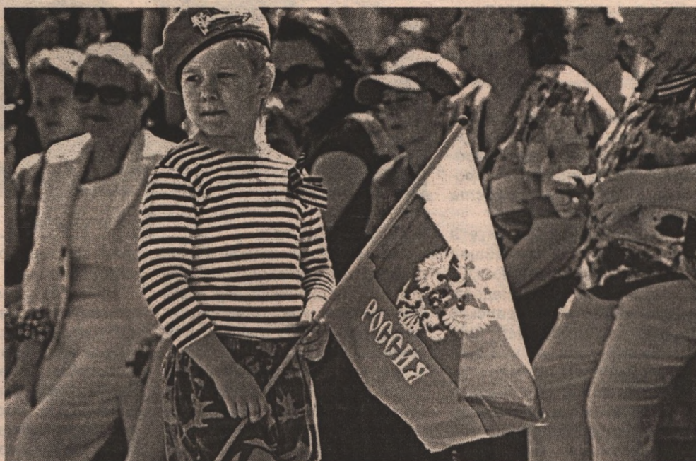
На Соборной площади г. Белгорода во время воинского парада.