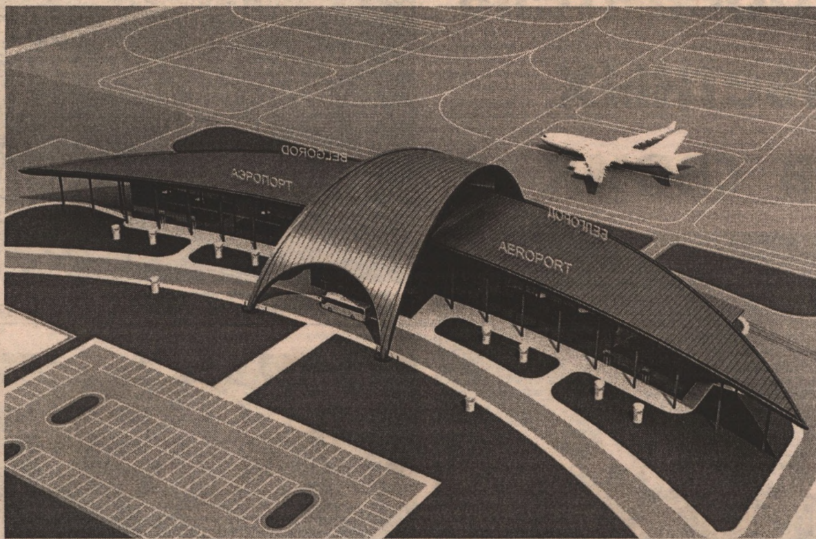
Так будет выглядеть новое здание АВК.

- 20 лет аэропорт не получал инвестиций. Износ оборудования более 90 процентов. Морально устарело все имущество. Аэропорт выжил только благодаря терпению и преданности