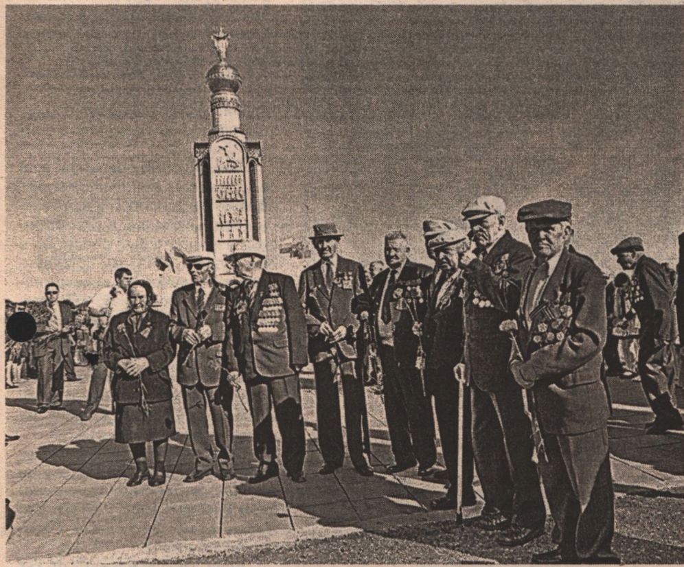
Памятник Победы – «Звонница» Государственного военно-исторического музея-заповедника «Прохоровское поле».