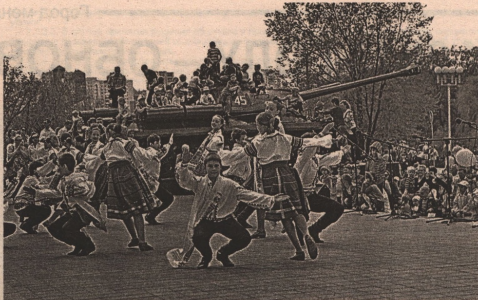
Концерт художественной самодеятельности у музея-диорамы «Огненная дуга».