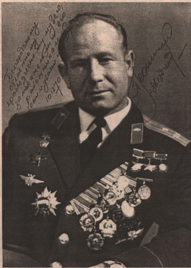
Космонавт Алексей Леонов.

Нынешний год объявлен Годом российской космонавтики, так как в стране отмечается 50-летие со дня первого полета человека в космос. Им, как известно, был Юрий Алексеевич Гагарин. А еще одно событие, связанное с покорением космоса, непосредственно касается нашего города: решением сессии городского Совета депутатов трудящихся от 19 марта 1965 года Алексею Архиповичу Леонову и Павлу Ивановичу Беляеву, летчикам-космонавтам, Героям Советского Союза, за большие заслуги в освоении космического пространства присвоено звание «Почетный гражданин города Белгорода».