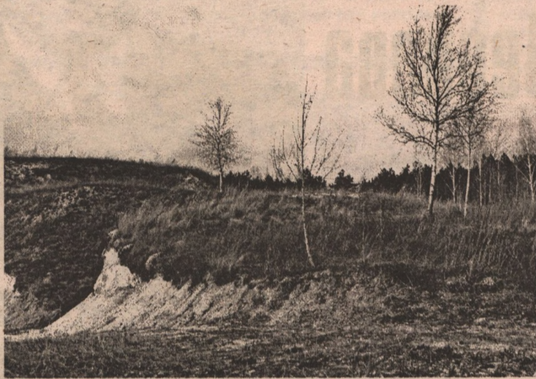
Меловые склоны уже освободились от снега.

В 1955 году на северной окраине села Ячнево на построенном аэродроме открылась авиационная метеорологическая станция для обслуживания полетов самолетов авиаотряда. Сейчас это основная станция, на которой ведутся климатические наблюдения на территории Белгорода. Всего же по области сегодня работают шесть метеорологических станций, 11 гидрологических постов, две лаборатории по наблюдениям за загрязнением природной среды, которые входят в состав Белгородского областного центра по гидрометеорологии и мо-