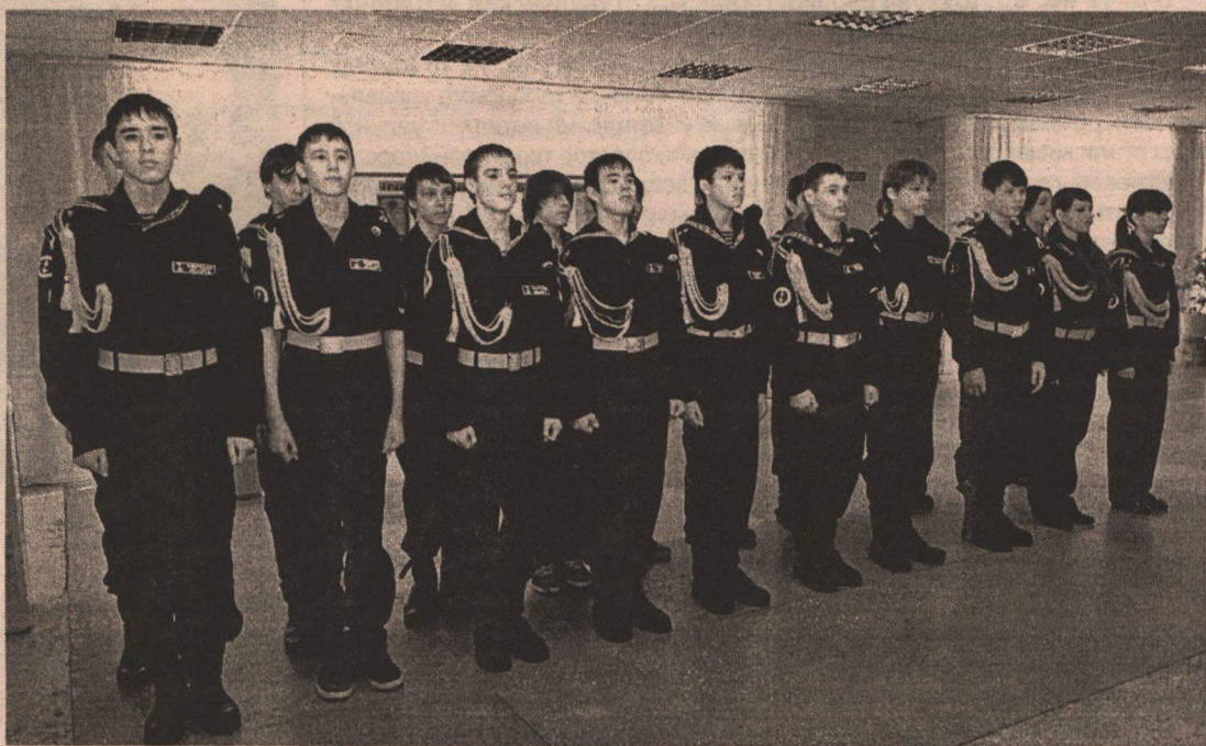
Кадеты к службе в армии готовы.

В Белгороде уделяется большое внимание военной подготовке будущих призывников. На сегодняшний день среди учащихся 10-11 классов на во-