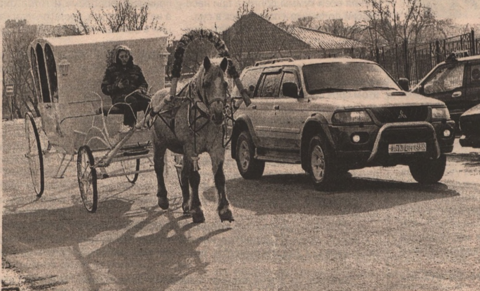
Такие разные лошадиные силы...

Для владельцев автомобилей вчера истек срок уплаты транспортного налога за 2010 год. Тем, кто вовремя не расплатился с государством, с 16 марта начисляется пеня в размере 1/300 ставки рефинансирования Центробанка за каждый день просрочки. Ставка на сегодня составляет восемь процентов.