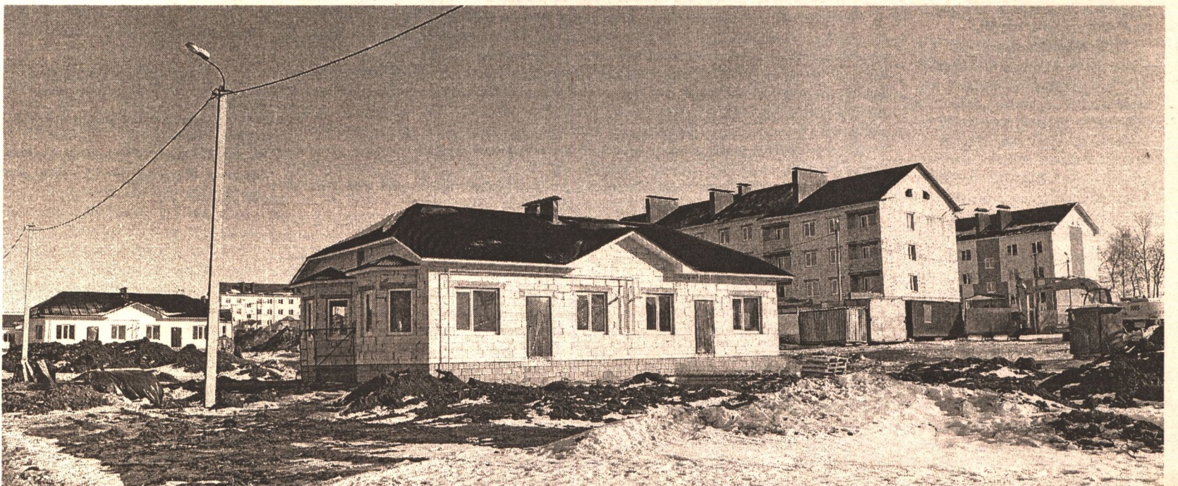
Микрорайон Восточный – панорама с западной стороны.