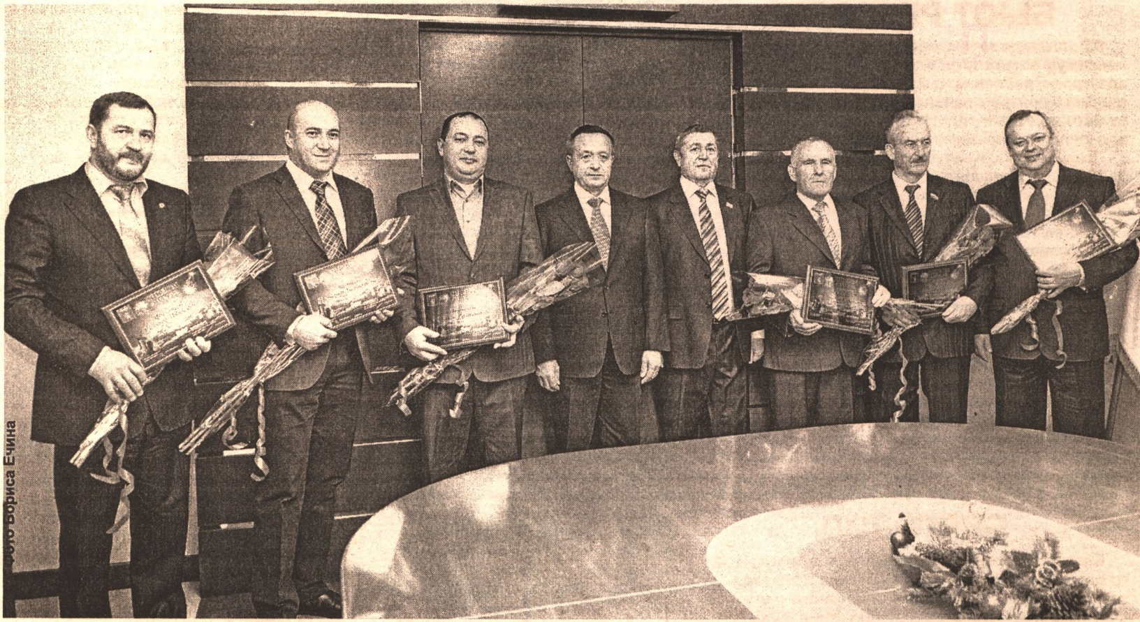
Меценаты года после церемонии вручения дипломов в администрации города.

Издавна в России уважали и почитали людей, которые умеют зарабатывать, но вместе с тем и вкладывают деньги в социально значимые проекты, помогают развиваться родному городу, делают много хорошего и доброго для его жителей. Накануне Нового года в областном центре отметили тех, кто внес наиболее значимый вклад в социально-экономическое развитие города в 2010 году. Высокого звания «Меценат года» удостоены 7 человек. Дипломы и теплые слова благодарности они получили от мэра Белгорода Василия Потрысаева.